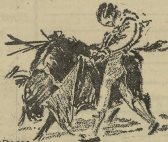
UN MULETAZO DE LA SERNA

vóse al toro a los medios y allí se muleteó cerca, valentísimo, con pases de varias marcas, metido entre pitones, ¡y aún llevóse a la izquierda la muleta y dió unos