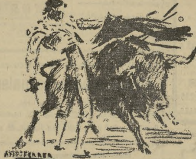
UN SUPERIOR PASE DE PECHO DE ARMILLITA

A mí me gustó enormemente al trastejar a su primero, en el que oyó música y olés. Le propinó al de Fernández, un toro cuya codicia la despachó toda con los caballos, primeramente unos muleta-zos por bajo superiores, cerca, mandón y valiente. Y luego siguió con otros por alto, afarolados, molinetes entre los pitones y con la izquierda dió dos pases que ligó con el de pecho, excelentes. Un pinchazo bueno y media estocada