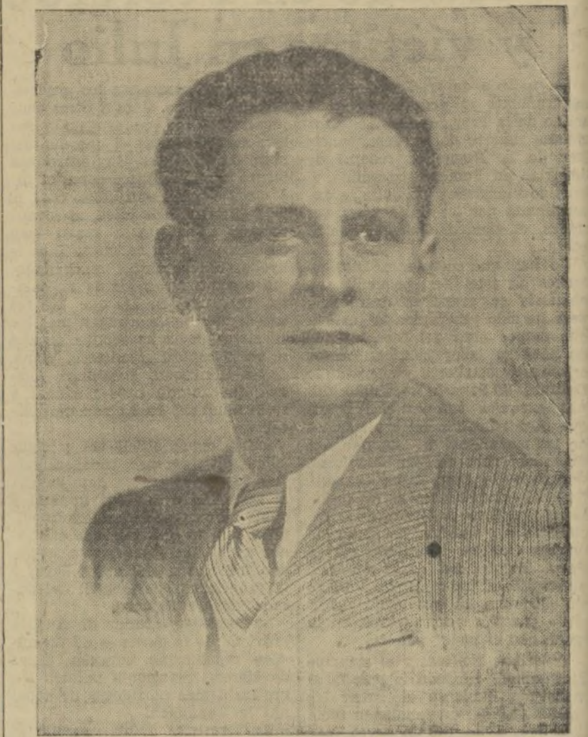
GIOVANNI MESLINI gran tenor lírico que actuará esta noche en «El Barbero de Sevilla»

«El barbero de Sevilla», para esta noche.--La «Aida», del sábado.--El homenaje a María Llácer para el domingo