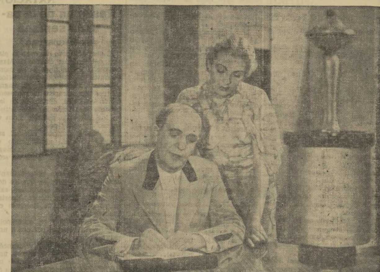
UNA ESCENA DE LA «HERMANA SAN SULPICIO», LA PELÍCULA ESPAÑOLA CUYA FILMACION HA CAUSADO EXPECTACION EN LA AFICION CINEMATOGRAFICA, QUE NOS PRESENTARA EN ESTA TEMPORADA LA CIFESA