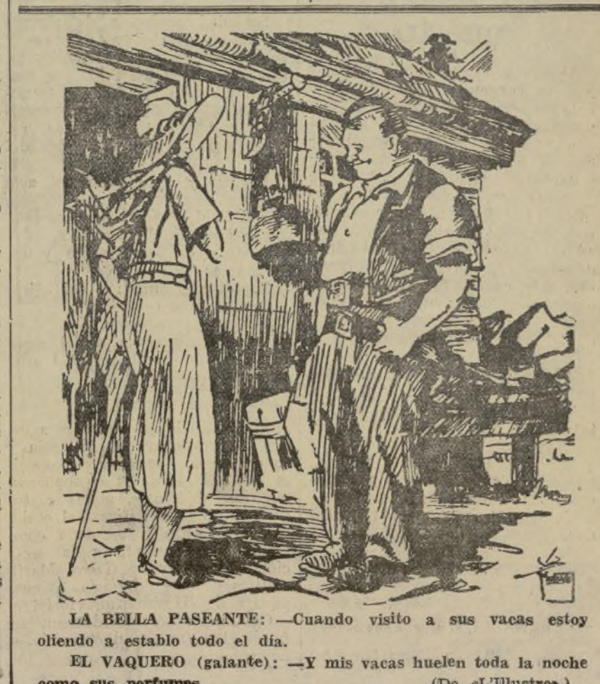
LA BELLA PASEANTE: —Cuando visito a sus vacas estoy oliendo a establo todo el día. EL VAQUERO (galante): —Y mis vacas huelen toda la noche como sus perfumes. (De «L'Ilustres».)