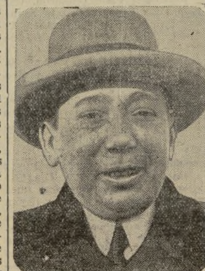
NICOLAS TITULESCO Ministro de Estado rumano, gran impulsor de la cordialidad de relaciones entre Rumanía y Yugoslavia, que actualmente se halla en Belgrado

Entonces conoció los tormentos del padre o del amante al borde de la tumba donde unos hombres implacables olvidan el cuerpo cuya vida era la razón de nuestro existir. Y quedóse mirando al mar