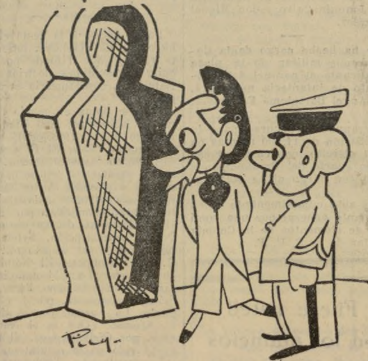
EL NUEVO CONSERVADOR DEL MUSEO: —Esta momia está asquerosa. Envíe usted las vendas a la lavandera.