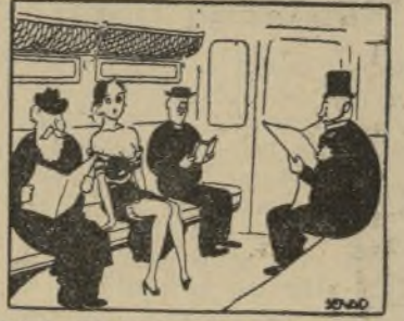
TRES HOMBRES SERIOS