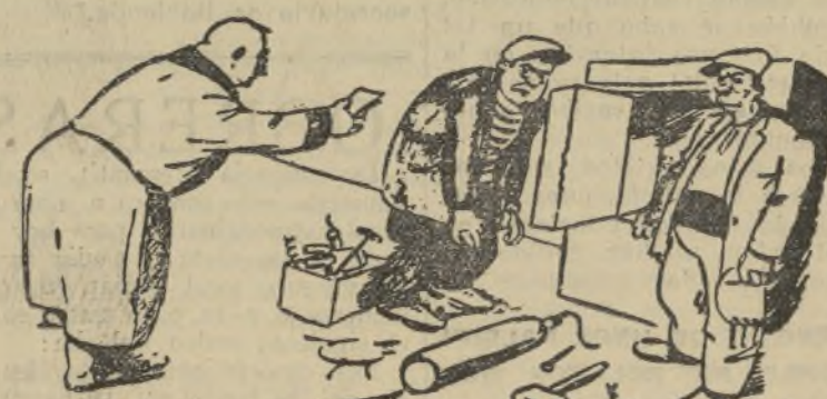
LA CAJA VACIA

EL SEÑOR (dirigiéndose a los ladrones): —Tengan cinco francos para cada uno. No quiero que nadie salga de mi casa diciendo que ha trabajado gratis. (De «Ric et Rac».)