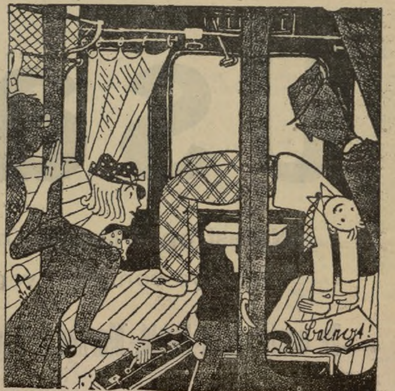
—Vengan pronto. Ya no puede seguir más tiempo así para guardar los asientos. (De «Fliegende Blaetter», de Berlín.)

Solicitada autorización por don Francisco Lerna para la instalación de un motor eléctrico de medio caballo de fuerza con destino a inflar neumáticos en la casa número 5 de la calle de Pelay, se abre juicio contradictorio por diez días para oír reclamaciones contra dicha instalación, terminando el plazo para ello el día 19 del actual mes. Valencia 7 de Septiembre de 1934. — El Alcalde accidental.