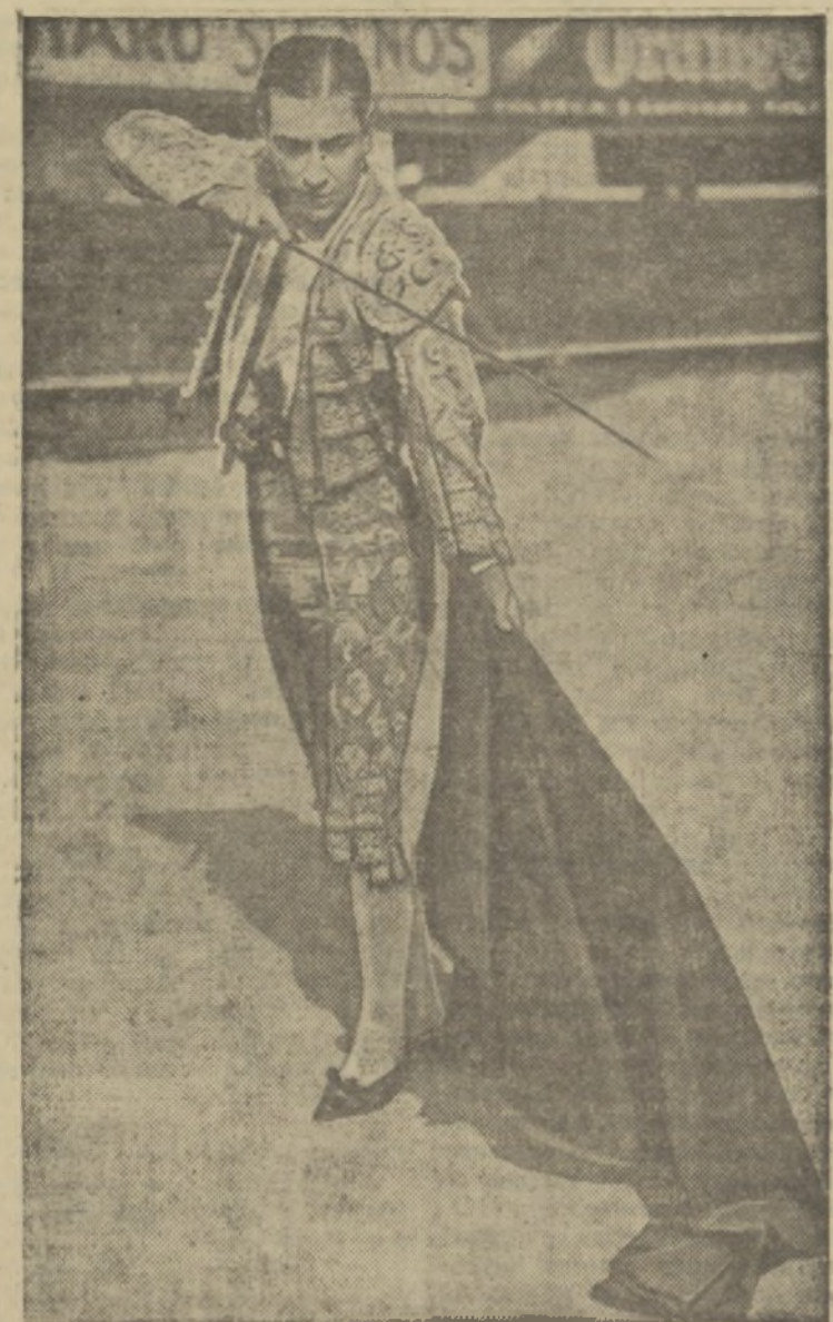
GEORGE RAFT, EL EXCELENTE ACTOR, «PERFILANDO EN CORTO Y POR DERECHO», EN UNA ESCENA DE LA PELÍCULA PARAMOUNT, «SUENA EL CLARIN»

Fantine, que en la primera parte de «Los miserables» es una mujer joven y bella, llena de soñadoras esperanzas, se halla en Montreuil-sur-Mer, a raíz de su