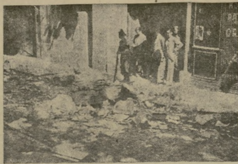
Estado en que quedó la calle frente a la Asociación de Dependientes, después del bombardeo