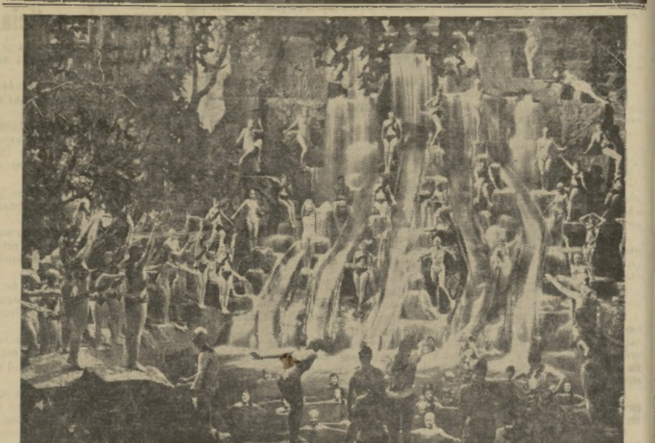
HE AQUÍ LA MARAVILLOSA ESCENA DE LA CASCADA HUMANA — EN ELLA INTERVIENEN CEN- TENARES DE BELLÍSIMAS ARTISTAS — DE LA EXTRAORDINARIA PRODUCCION «DESFILE DE CANDILEJAS», QUE LA WARNER BROS-FIRST NATIONAL ESTRENARA MUY EN BREVE EN EL OLYMPIA