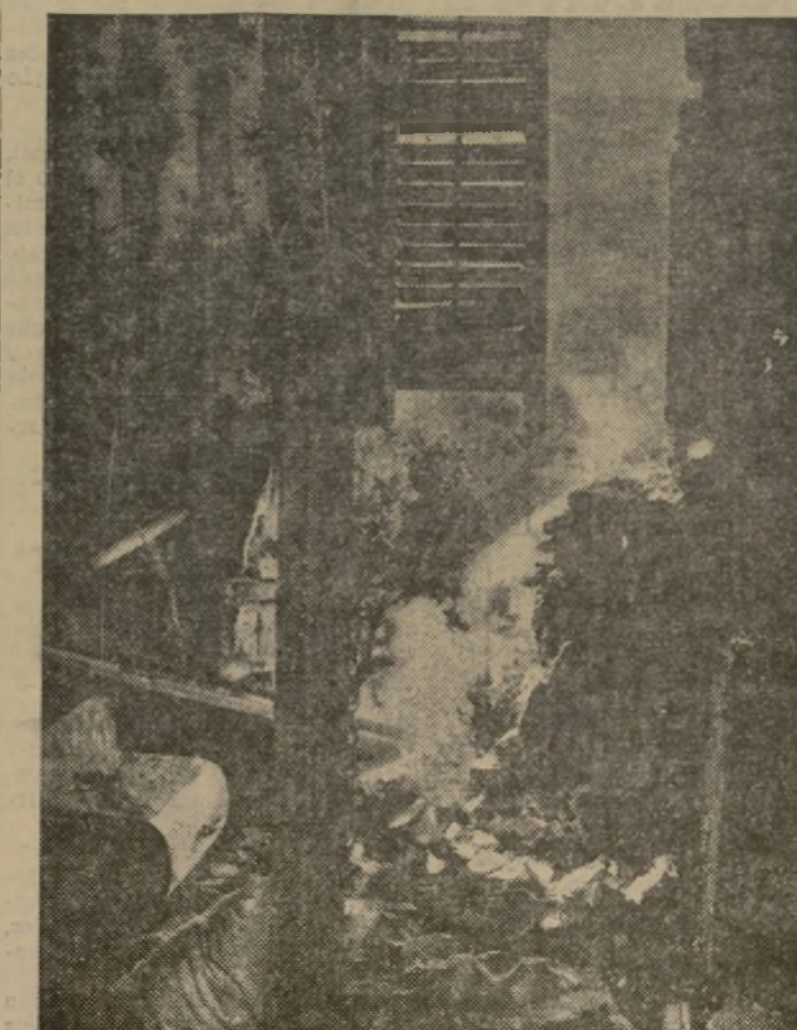
Destrozos causados en la casa contigua al Centro de Dependientes, en la Rambla de Santa Mónica, a la que alcanzaron varias granadas durante el cañoneo

Oímos en Valencia hablar de miles de muertos y la realidad reduce esta cifra a términos que sorprenderán, pero de cuya veracidad respondemos.