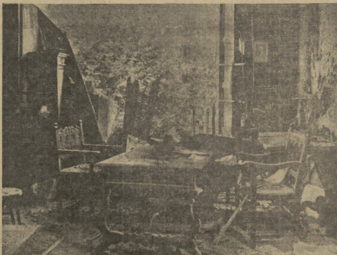
El interior de la sección de Fotografía del C. A. D. C. I., donde mayores fueron los desperfectos causados por los cañonazos

Parece que desde que empezó a actuar la pieza de artillería los elementos que se hallaban en el Centro hicieron poca resistencia al