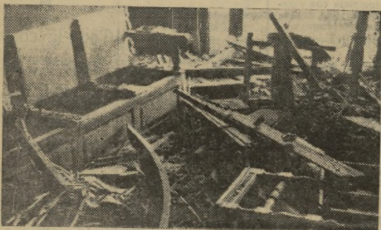
El Consistorio del Ayuntamiento de Granollers

EXERCIT NACIONAL DE CATALUNYA SERVEI D'INCAUTACIO