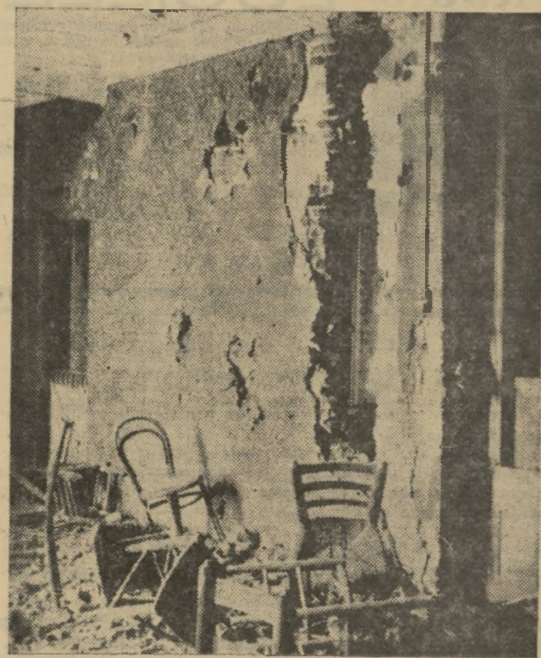
Otro aspecto del bombardeo en el local del Centro Socialista Español