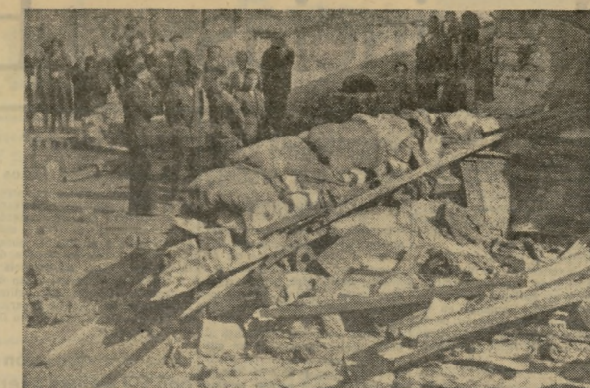
BARRICADA EN LA BARRIADA DEL LLANO DE GIJÓN Y EN LA QUE FUERON COPADOS LOS QUE LA OCUPABAN