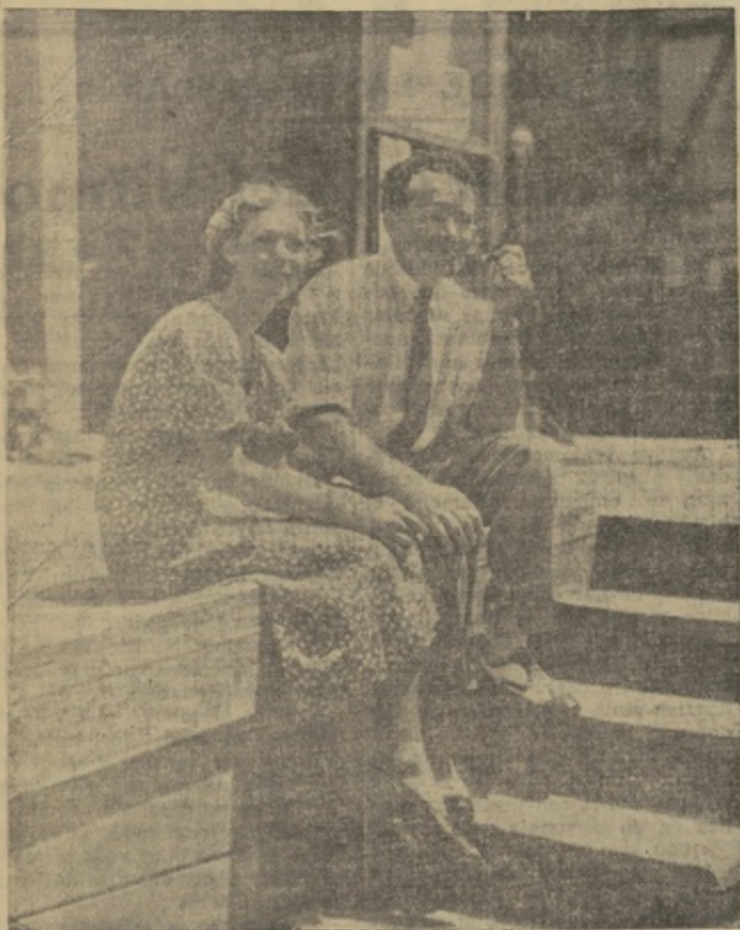
Loretta Young y Frank Borzage en un descanso durante la filmación de la película Columbia-Cifesa «Fueros humanos», de la que son la protagonista y director respectivamente.