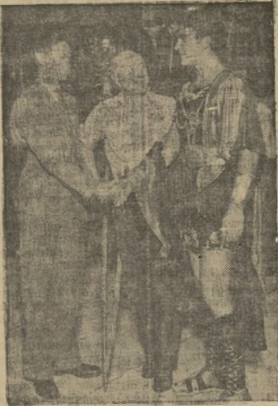
CECIL B. DEMILLE, DIRECTOR DE LA PELICULA "CLEOPATRA", PRESENTA MARCO ANTONIO A MARCO ANTONIO

Mientras filman "Cleopatra", aparece en el estudio un Marco Antonio verdadero