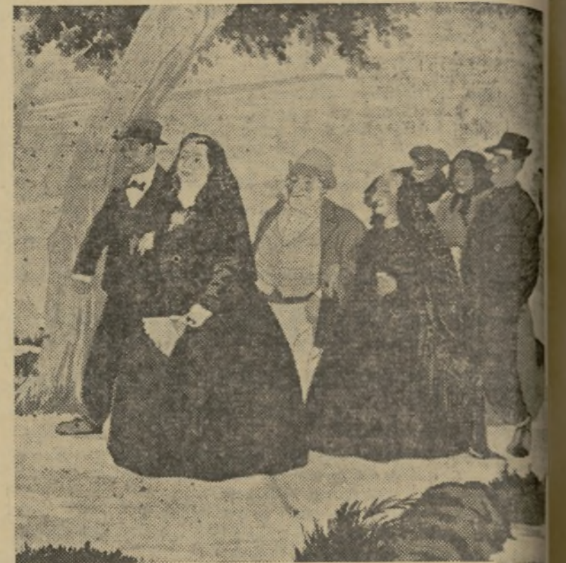
HE AQUI UNO DE LOS LIENZOS DE VERCHER EXPUESTO EN EL CIRCULO DE BELLAS ARTES

un artista de ansias de renovación y conocedor de los variados procedimientos que podía emplear en la práctica de su arte. Vercher, después de muerta, triunfó plenamente con