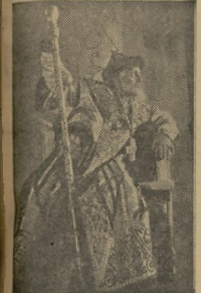
Irán el Terrible, el primero que tomó el título de zar en el siglo XVI y que tanto se hizo temer por su brutalidad

En la antigüedad clásica se dio el milagro de Grecia, coronada de violetas. No se ha vuelto a repetir en ningún otro pueblo. Lo de Rusia es un misterio en el que no pueden penetrar los mismos que van allá para descubrirlo. Es un puro enigma lo que sucede en esta sexta parte del mundo habitado. A los cuatro millones y medio de kilómetros cuadrados que cubre Europa, se oponen como un formidable contrapeso asiático los veintinueve millones de kilómetros cuadrados que mide la Rusia inabundante, todo un continente poblado por 172.000.000 de seres y que se multiplicarán hasta sumar los 200 millones dentro de quince