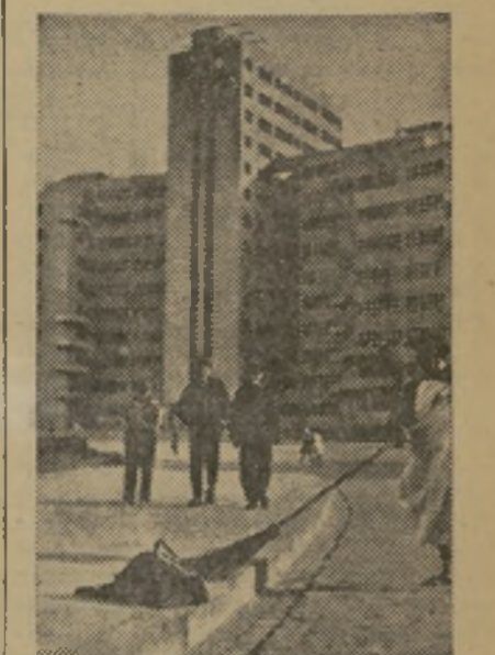
Modelos moscovitas de arquitectura cubista

Lo que pone en peligro no son las revueltas locales seguidas de ejecuciones en masa ni la pérdida de confianza de la opinión en sus jefes. La amenaza la constituye la misma oligarquía reinante. El partido comunista—único que existe—