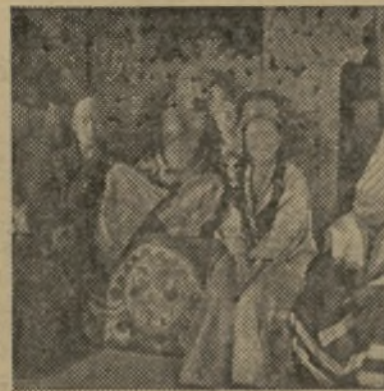
Compañía soviética organizada por el Estado para la propaganda antirreligiosa

No hay que asombrarse de que en las ciudades, junto a los museos antirreligiosos, haya iglesias comunistas, llamadas museos de la Revolución. En el de Moscú, que consiste en una sucesión de salas, están representados, siguiendo las etapas de la Historia, el marino-logio y el triunfo de la Revolución. La primera revuelta de los campesinos en el siglo XVII. En el siglo XVIII, la del cosaco Pugat-chew, cuyo cadáver, así como los de sus cómplices, es paseado por las calles de Moscú. El retrato de los «decembristas» de 1825, de los