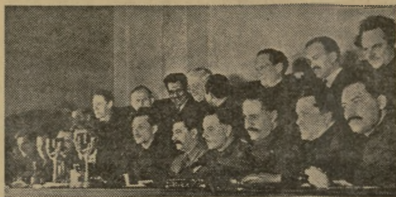
XVII Congreso del partido comunista bajo la presidencia de Stalin, al que acompañan Vorochilov, Ordjonikidze y Molotov

La nueva religión rusa persigue realizar un sistema social que tiene por eje la perfectibilidad del individuo lo mismo que las supersticiones primitivas y las actuales religiones competidoras. Sin embargo, la perfectibilidad del hombre, la máxima libertad individual que surge de la dignificación del ser humano, es la antítesis del espíritu colectivista que anima al régimen ruso.