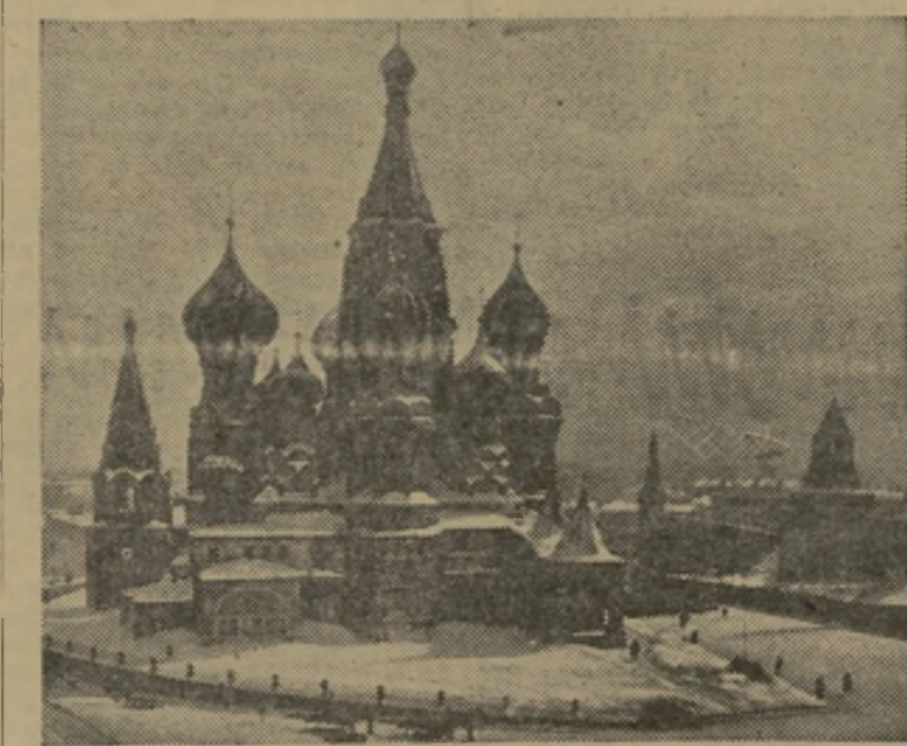
San Basilio y el Kremlin, en la plaza Roja de Moscú, bajo la nieve

La verdad indiscutible es que en Rusia, como en todas partes, han fracasado el marxismo puro y el socialismo científico. Las masas proletarias han visto crecer su «estándar» de vida con la concentración capitalista. Han adquirido el sentido de la posesión y se vuel-