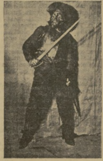
Radzovitch, el gran actor soviético, en una caracterización de Don Quijote

A despecho de la coacción del Plan, el ruso ha conservado esta parte irreductible de fantasía, ese gusto por lo irreal y fantástico que existe en todo ser humano y que, en los niños, como en los niños, se exasperan de frescura receptiva y de una sensibilidad aguda. Con una finura inconcebible el más torpe advierte las notas musicales y las coloraciones más tenues. En él lo inconsciente domina lo consciente y vibra con resonancias profundas que escapan al análisis razonable. De aquí la afición ardiente