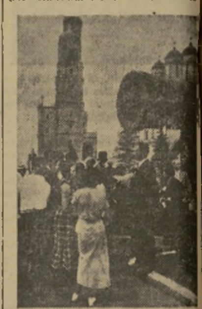
La torre de Iván el Terrible en Moscú