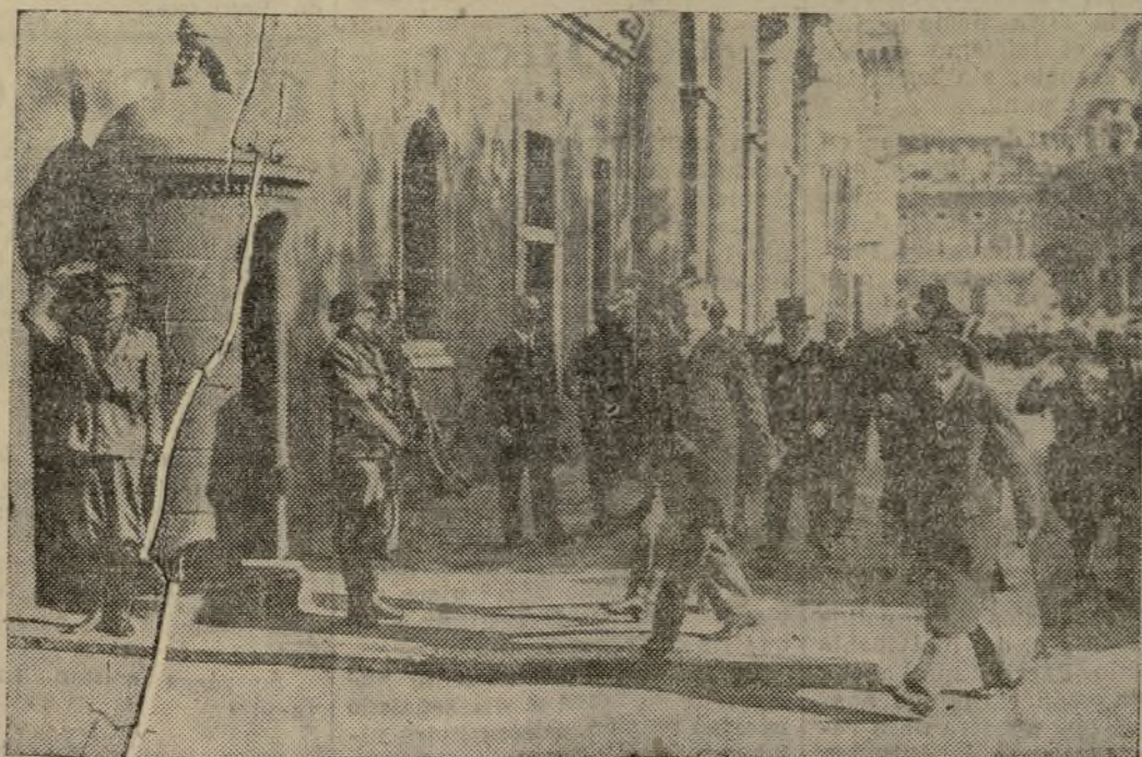
El canciller Schuschnigg, acompañado de Mr. Berger-Waldnegg, ministro austriaco de Negocios Extranjeros, dirigiéndose a pie al Palacio de Venecia para entrevistarse con el Duce.