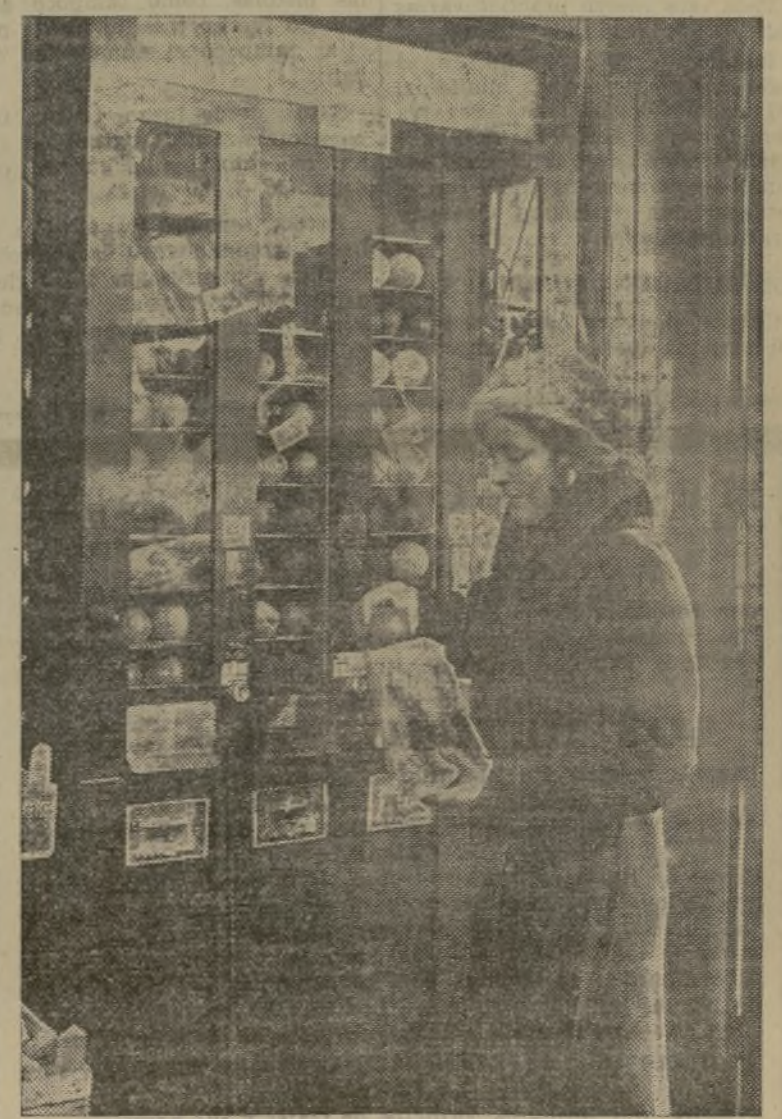
En Berlín se ha inaugurado en un gran establecimiento de comestibles, un aparato automático para la venta de frutas, novedad que ha sido recibida con satisfacción por el público berlinés. Este aparato automático permite proveerse rápidamente de fruta sin tener que esperar que los dependientes del establecimiento despaquen a los clientes que ya esperan, teniendo además la ventaja de que sigue funcionando después de la hora de cierre del establecimiento