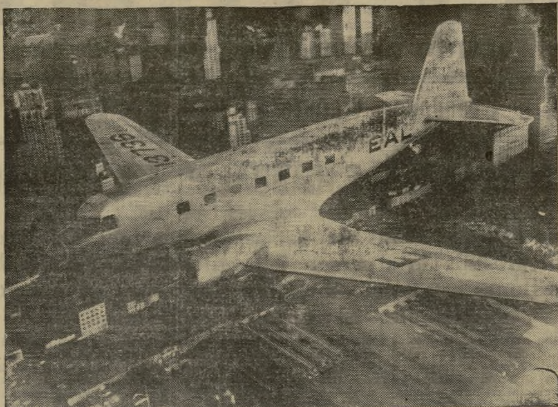
Después del record aéreo del capitán de la aviación militar americana Edie Rickenbacker de Nueva York a Los Angeles, se instaurará en dicho trayecto un servicio regular, volando los aparatos por las zonas de la estratosfera. El aparato del capitán Rickenbacker, durante su vuelo por la estratosfera, volando sobre Nueva York