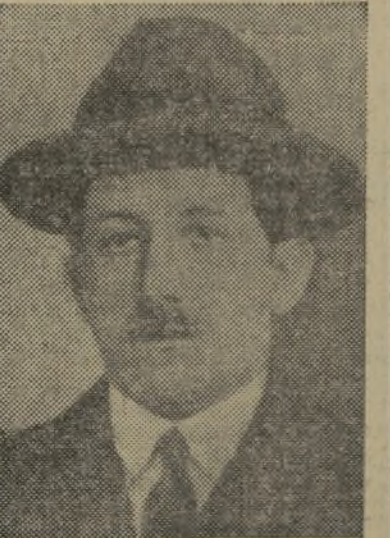
Retrato del famoso Stavisky hecho en 1926, cuando un bigote cuestionó se hermanaba con una mirada honesta

Monte de Piedad. Así es como en tres ocasiones obtuvo Stavisky hasta 29 millones a cuenta del collar, cantidad excesiva porque el reglamento de los Créditos Municipales de Francia sólo autoriza anticipos por valor de las dos terceras partes del valor de la joya.