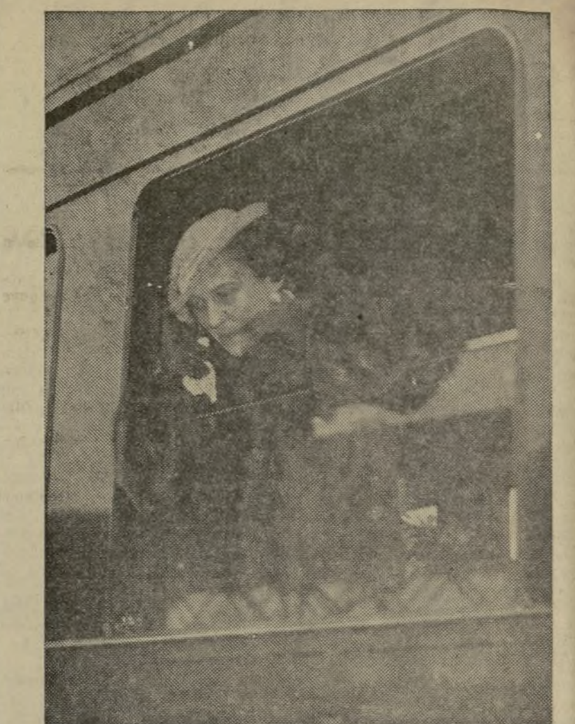
¡ADIOS, PARIS! El último retrato de la princesa María al salir para Londres, donde ha de contraer matrimonio con el duque de Kent. La princesa, en la ventana, a la salida del tren.

De las gestiones realizadas con posterioridad se deduce que el atraco se llevó a cabo en uno de los trenes de la mañana, donde viajaban un cobrador de dicho Banco y un apoderado, portadores de 54.000 pesetas.