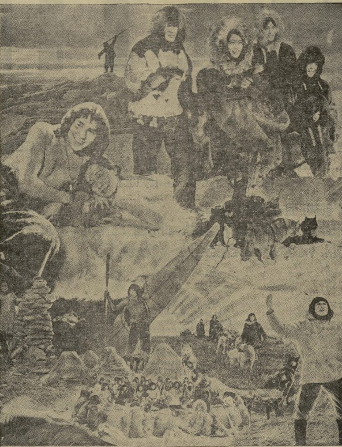
«ESKIMO», la magnífica película de William S. Van Dyke, inspirada en la novela de Peter Freuchen «Un poema épico de los lindes del mundo habitados»