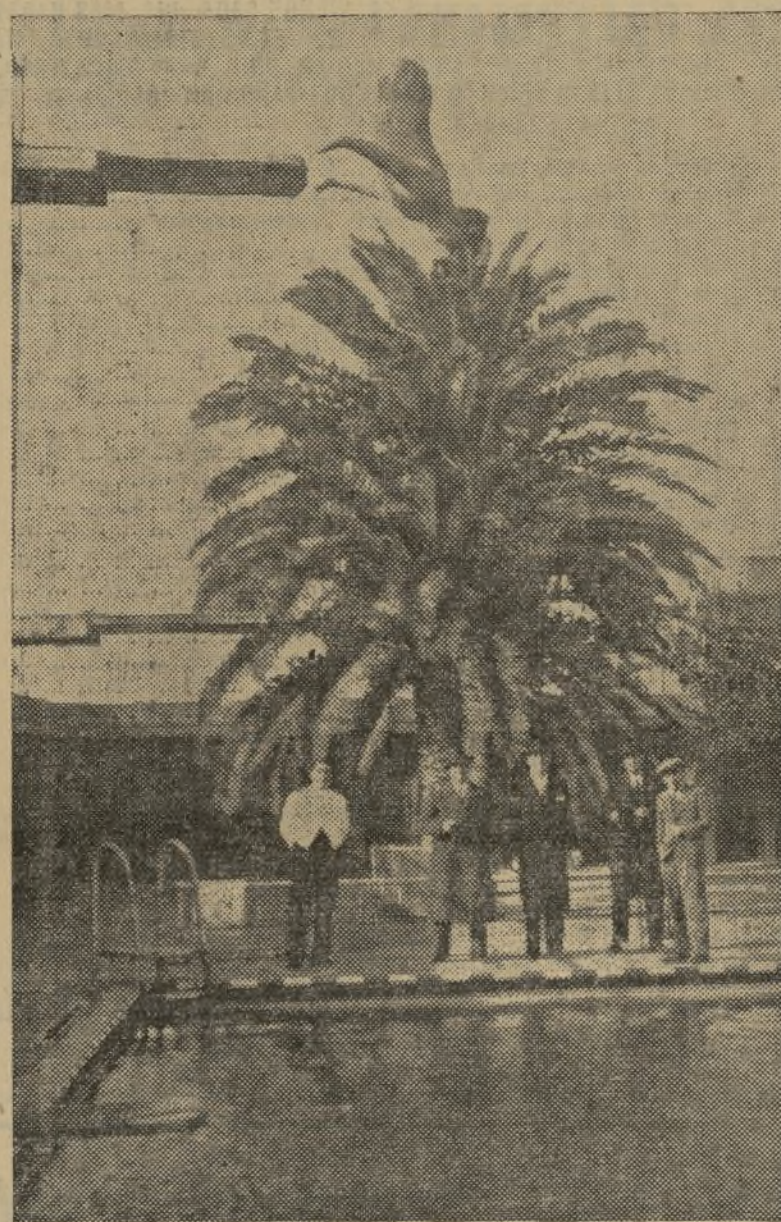
EL «HOMBRE PEZ» LANZÁNDOSE AL AGUA DESDE EL ÚLTIMO TRAMPOLIN DEL CLUB NAUTICO

Así va por toda Europa, como antes anduvo por América. Mostrando a los hombres sus portentosas facultades: permanece horas y horas en el agua, y, sumergido, fuma, come y bebe, pudiéndolo apreciar el público porque sus exhibiciones