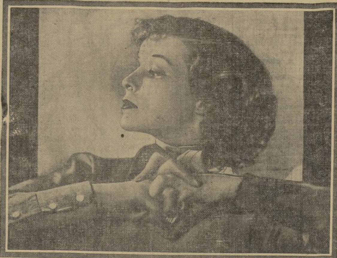
UNA POSE CARACTERÍSTICA DE KATHARINE HEPBURN, ACTRIZ DE GRAN CÉLEBRIDAD. CONTRIBUCIONES AL SEPTIMO ARTE, LA HAN COLOCADO EN LA CUMBRE DE LA FAMA CINEMATICA

Sabemos de buena fuente que algunos empresarios de reconocida capacidad y experiencia en el negocio cinematográfico, han tenido ocasión de admirar, en sesión íntima, la gran producción de los señores Balart y Simó, «El negro que tenía el alma blanca», y