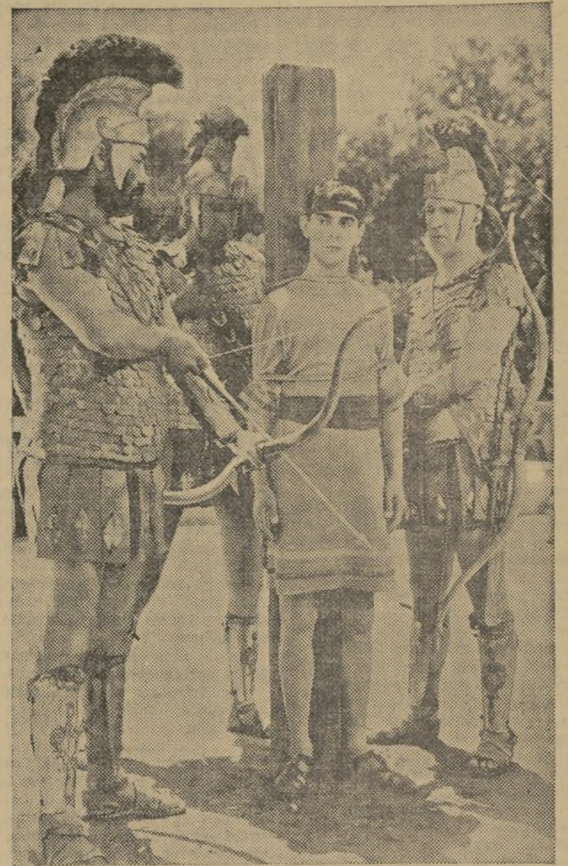
UNA ESCENA DE LA NUEVA PELICULA DE EDDIE CANTOR «ESCANDALOS ROMANOS», QUE ESTRENARA MUY PRONTO EL CAPITOL

Esta extraordinaria película de Cinematografía Mexicana, que distribuye Filmófono, S. A., será presentada en breve en uno de nuestros más elegantes salones.