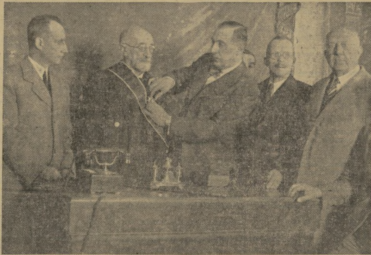
EL GOBERNADOR CIVIL DE CASTELLÓN, EN REPRESENTACIÓN DEL GOBIERNO, IMPONIENDO LA BANDA DE LA ORDEN DE LA REPÚBLICA AL PRESIDENTE DEL TRIBUNAL DE GARANTÍAS CONSTITUCIONALES DON FERNANDO GASSET

La elección de don Fernando Gasset para la presidencia del Tribunal de Garantías ha sido un acierto, como lo prueba la extraordinaria votación obtenida en el Parlamento.