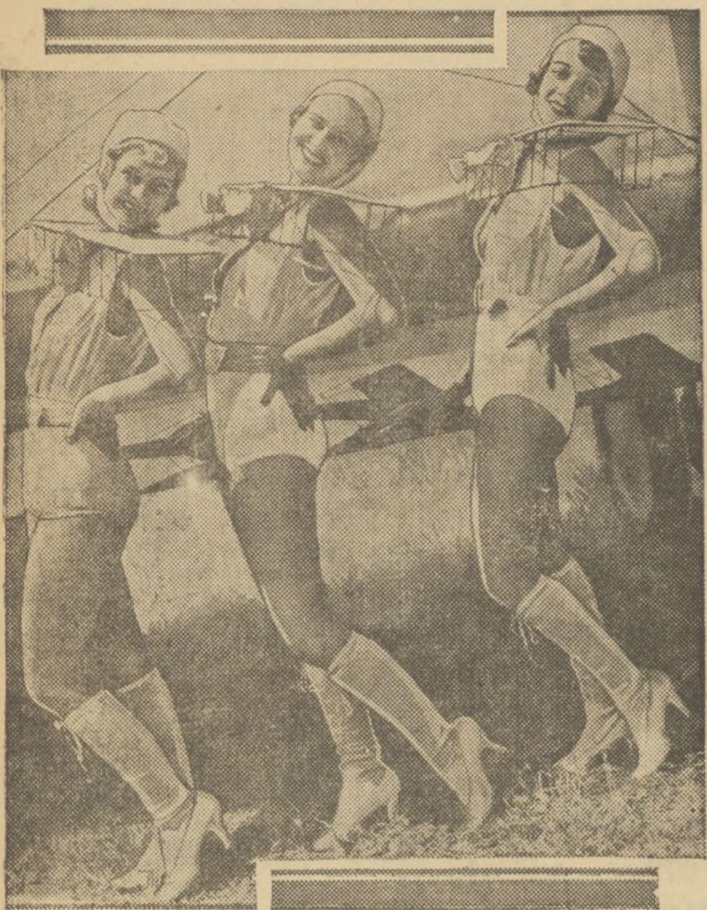
TRES BELLEZAS DE LAS MUCHAS QUE TOMAN PARTE EN LAS FIGURAS COREOGRAFICAS A BORDO DE AEROPANOS, DE LA PELICULA «VOLANDO HACIA RIO DE JANEIRO», QUE SE PROYECTA EN EL SUIZO CON GRAN EXITO