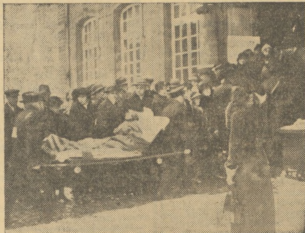
FRENTE AL AYUNTAMIENTO DE SARREBRUCK, FORMAN COLAS PARA VOTAR, INCLUSO LOS TULLIDOS

Ginebra.—Se ha llegado a un acuerdo definitivo entre los gobiernos de Berlín y París sobre los términos de la resolución por la cual el Consejo de la Sociedad de Naciones pronunciará la unión del Sarre al Reich y fijará la fecha de la incorporación.