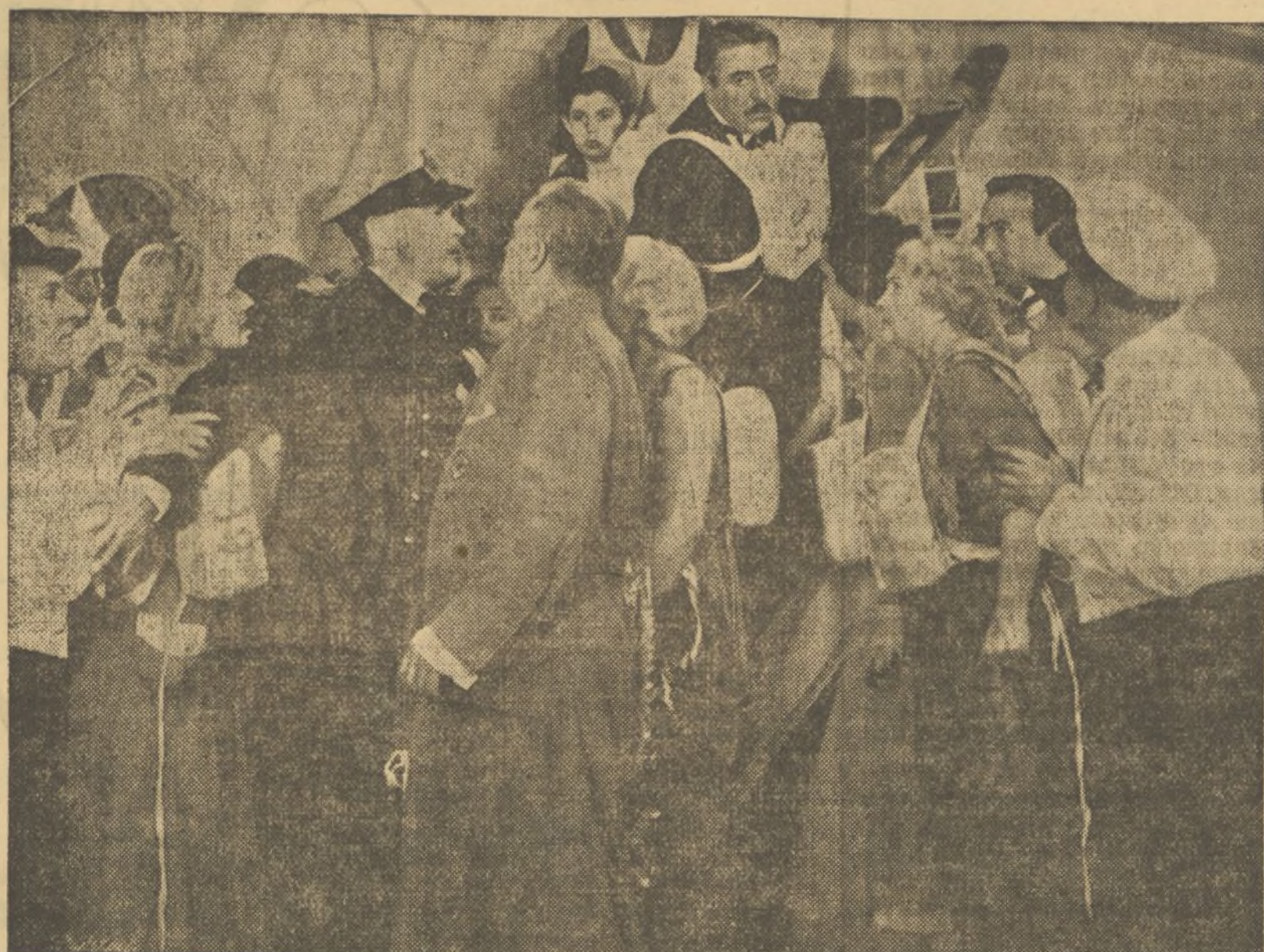
UNA INTERESANTE ESCENA DE LA PELÍCULA COLUMBIA-CIFESA «LO QUE LOS DIOS DESTROYEN», EN LA QUE EL PAPEL ESTELAR ESTÁ A CARGO DEL GRAN ACTOR WALTER CONOLLY

Este film nos será presentado ante nuestro público por Exclusivas Febrer & Blay, las cuales están seguras de que obtendrá el éxito logrado en su reciente estreno en París.