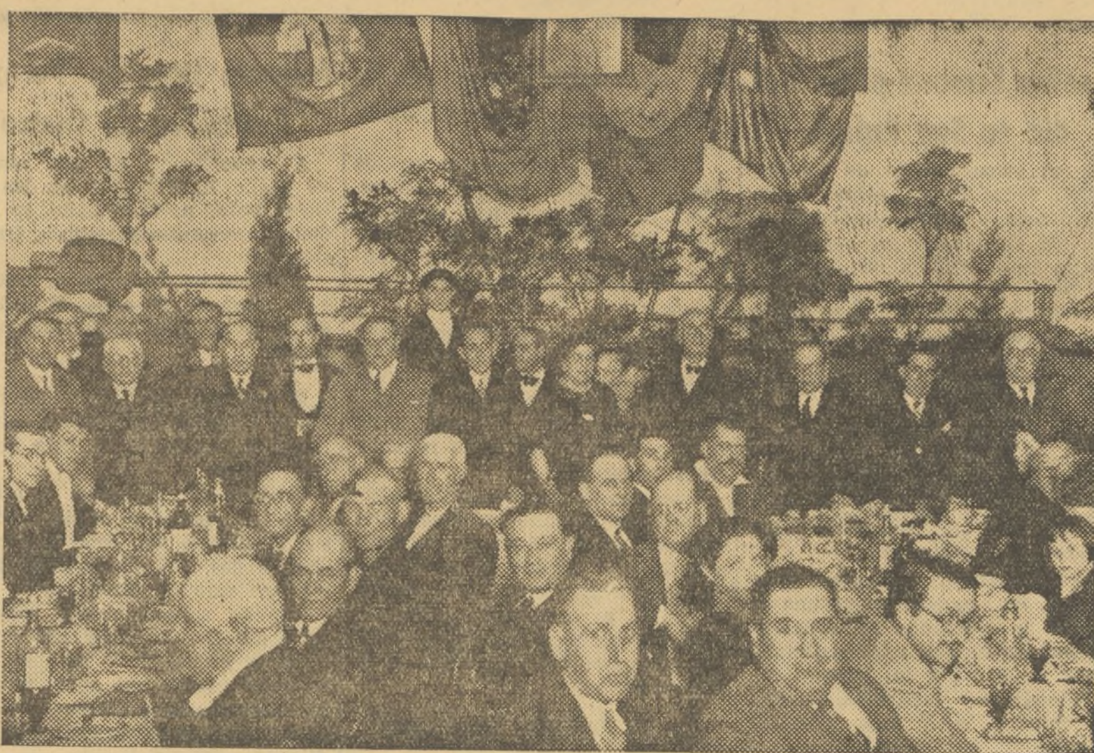
LA MESA PRESIDENCIAL DEL ACTO

Verdaderamente resonante fue el acto celebrado anoche en la Casa de la Democracia. Nuestro Partido dió pujante prueba de su vitalidad y dinamismo, llenando el amplio salón columnario de la Casa Central cerca de un millar de correligionarios.