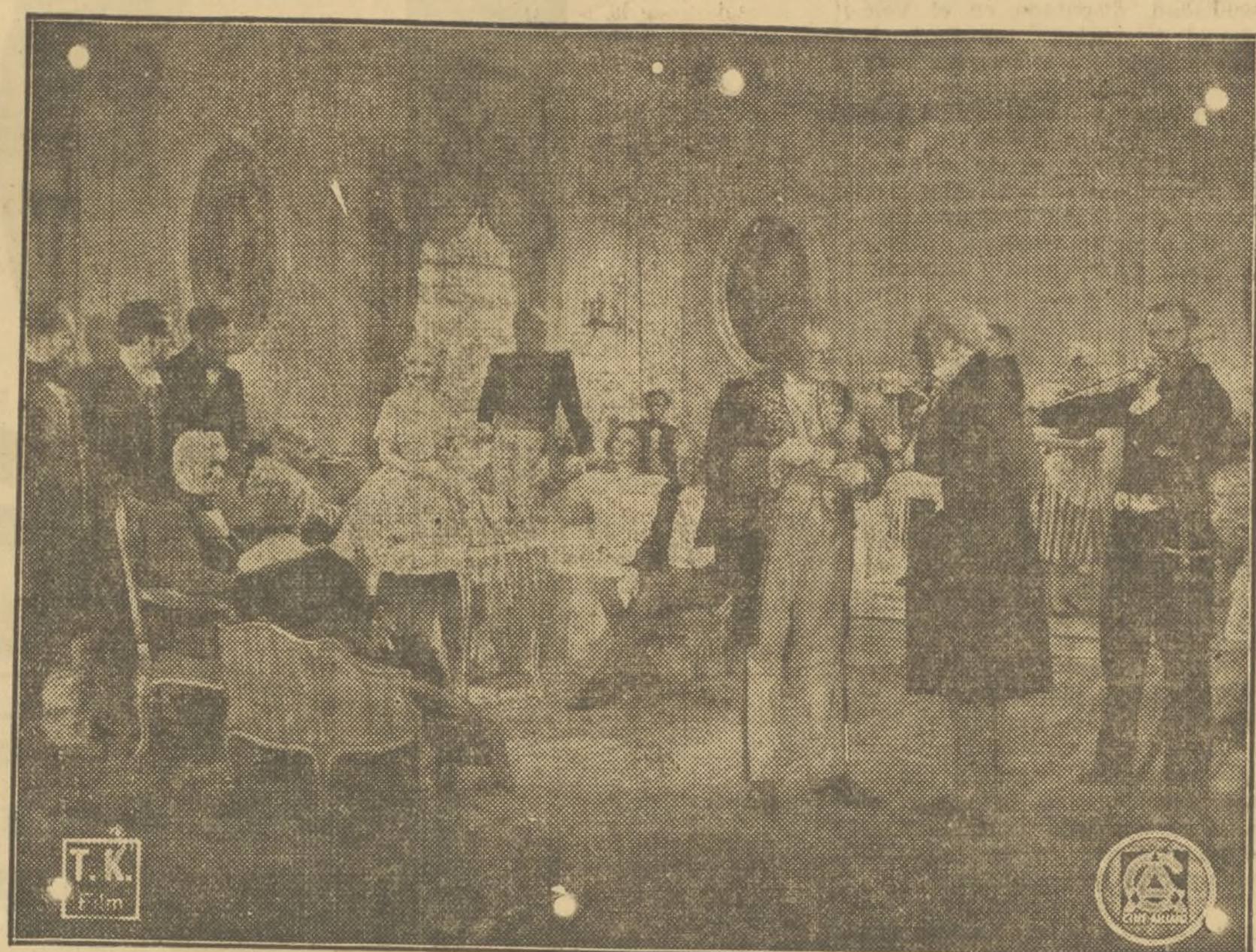
UNA INTERESANTÍSIMA ESCENA DE LA PRODUCCIÓN «SU MAYOR ÉXITO», DE LA QUE ES SU PROTAGONISTA LA BELLA «STAR» MARTA EGGERTH, QUE SE ESTA PROYECTANDO CON ÉXITO EN EL SUÍZO

¡Qué ingenio es nuestro estimador señor Fornis! Con estas sus palabras nos demuestra claramente que desconoce el negocio cinematográfico. Vamos a ser más claros. En España tenemos unas