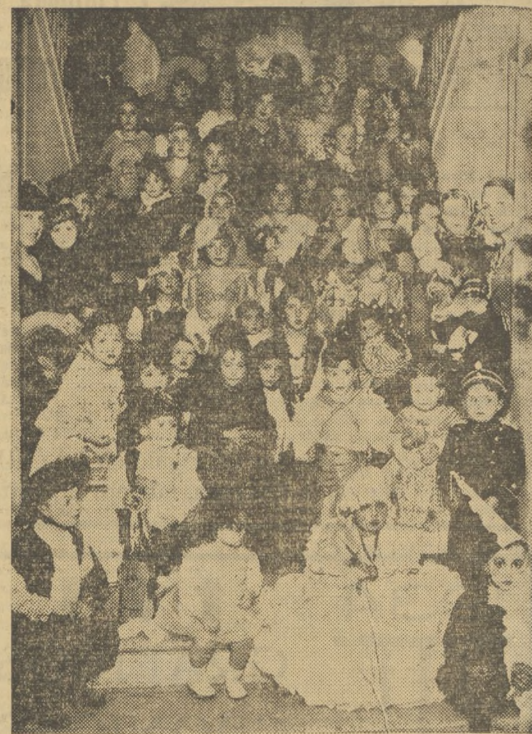
GRUPO DE NIÑOS QUE ASISTIERON A LOS BAILES QUE LA ASOCIACIÓN DE LA PRENSA HA CELEBRADO EN EL TEATRO PRINCIPAL

Niños: 677.—Un triciclo, del Centro Aragonés.