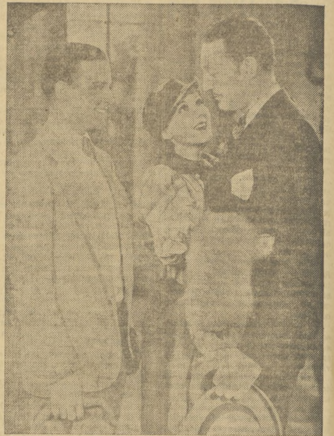
UNA ESCENA DE LA PELÍCULA COLUMBIA-CIFESA «DAMA POR UN DÍA», QUE HOY ESTRENA EL OLYMPIA

Sus primeros éxitos profesionales los obtuvo en el drama, bajo la dirección de von Stroheim. Hoy, sin embargo, es una de las más aplaudidas actrices cómicas del cinema mundial, y en «Música y mujeres» obtiene su mayor éxito.