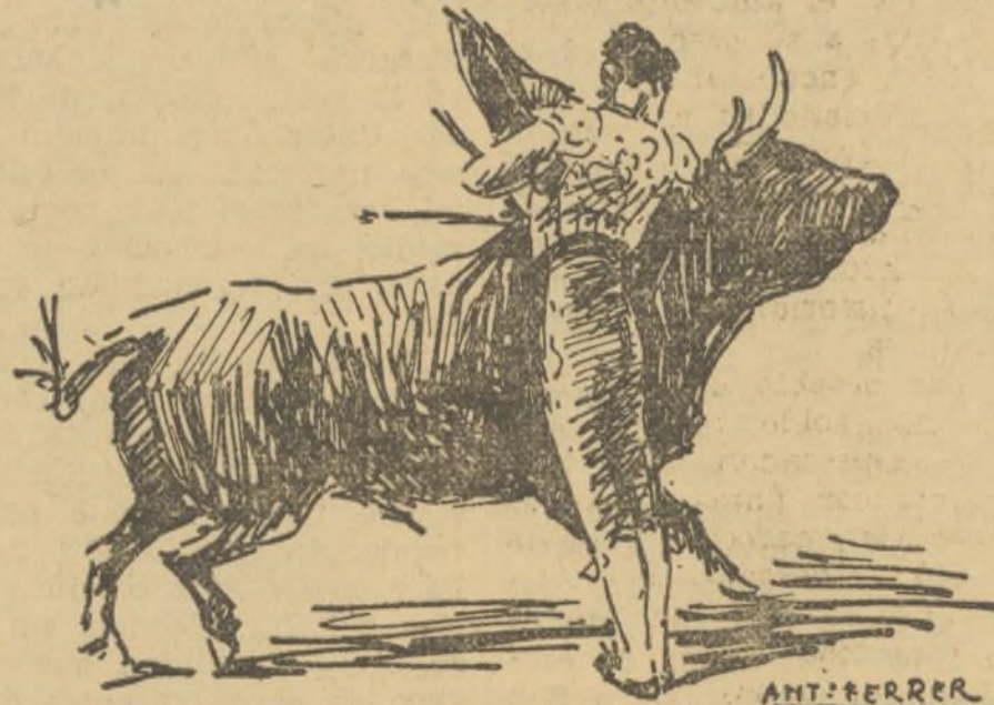
UN PASE POR ALTO DE MARTÍNEZ

Recogió a su primero con unos lances a la verónica superiores, que remató con media y luego en quites, los mejoró.