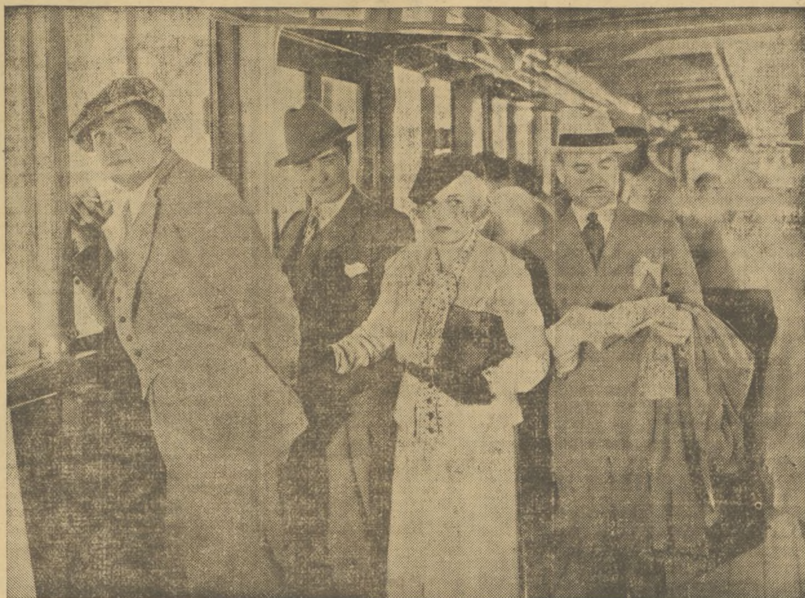
UNA ESCENA DE LA PRODUCCION COLUMBIA «EL CAPITAN ODI EL MAR», PROTAGONIZADA POR JOHN GILBERT Y QUE DISTRIBUYE LA VALENCIANA ENTIDAD CIFESA

Con el envío de este film a la Exposición Cinematográfica Internacional de Venecia, Josef Rovensky ha conquistado para Checoslovaquia uno de los puestos de avanzada del cine mundial.