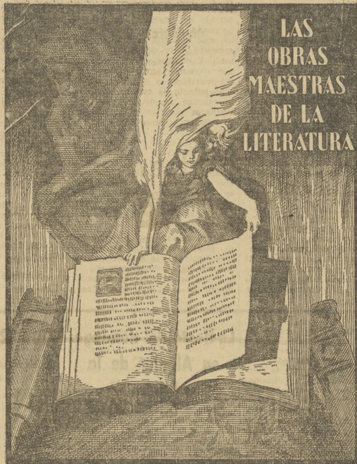
Reducción de la cubierta del primer fascículo