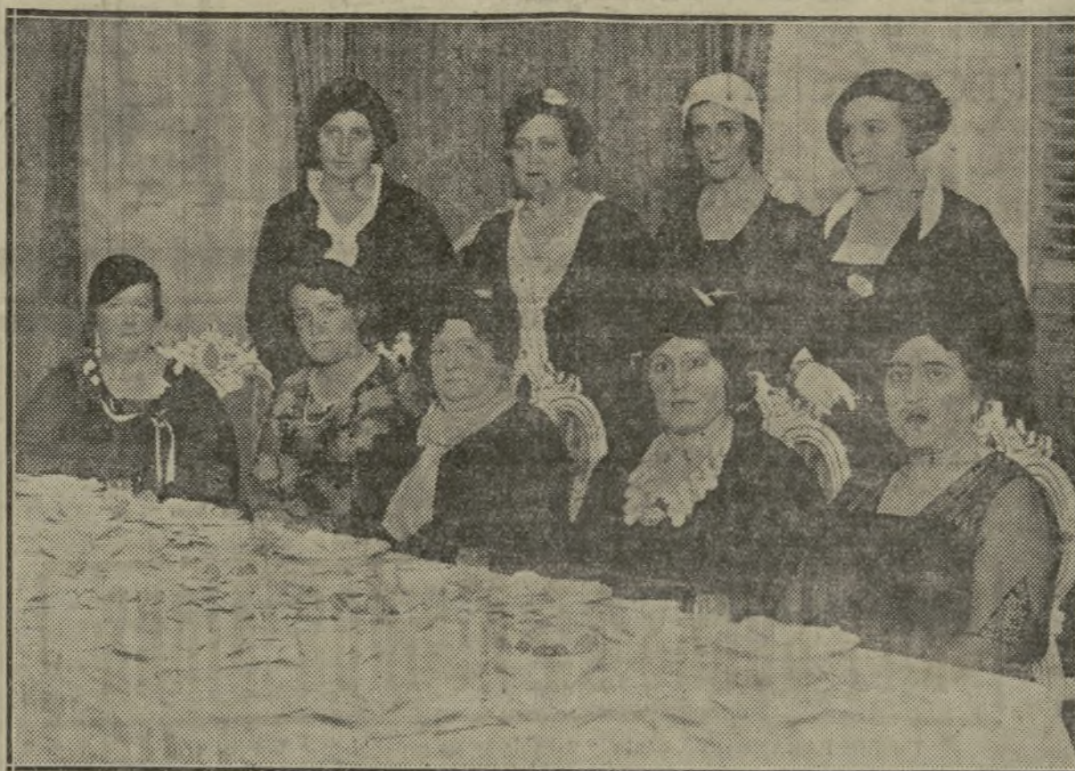
Las señoras que componen la Junta Republicana de Protección a la Mujer, reunidas en el Gobierno civil, donde fueron obsequiadas con un te por su presidenta la esposa del Gobernador civil don Francisco Rubio.