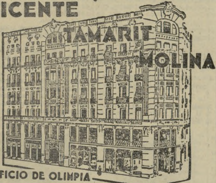
EDIFICIO DE OLIMPIA

Camas metálicas muebles de todas clases pianolas y rollos musica cochecitos para niños VICENTE