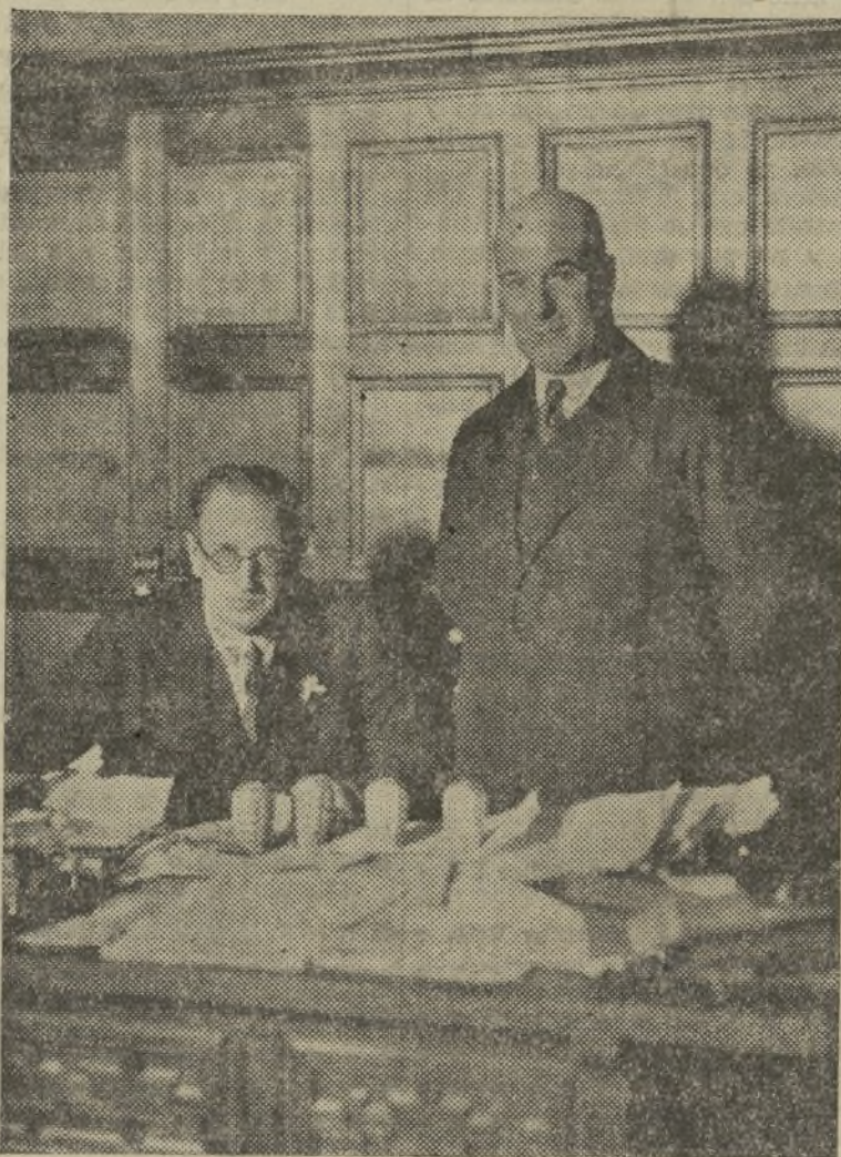
El Gobernador civil don Francisco Rubio, con el comisario de vi-gilancia don Julián Seseña, conferenciando sobre el hallazgo de las bombas.

—¿De qué clase son las bombas? —le preguntamos. —De forma de pifa, de más de un kilo de peso; llevan como ma-teria explosiva dinamita y del sis-tema de percusión. Por cierto que al ir a entrar el camión en el Gobierno civil pudo haber un in-cidente. Al doblar aquél, un auto que venía detrás le dio un encon-tronazo y de haber volcado el ca-mión podría haber explotado al-