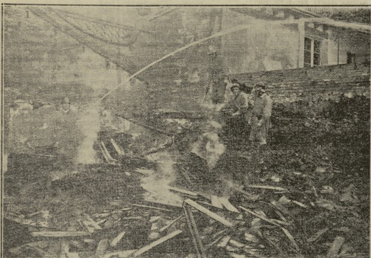
Estado en que quedó el almacén de naranjas siniestrado, cuyas pérdidas se elevan a unas trescientas mil pesetas

El fuego destruye el edificio, causando pérdidas por valor de unas 300.000 pesetas