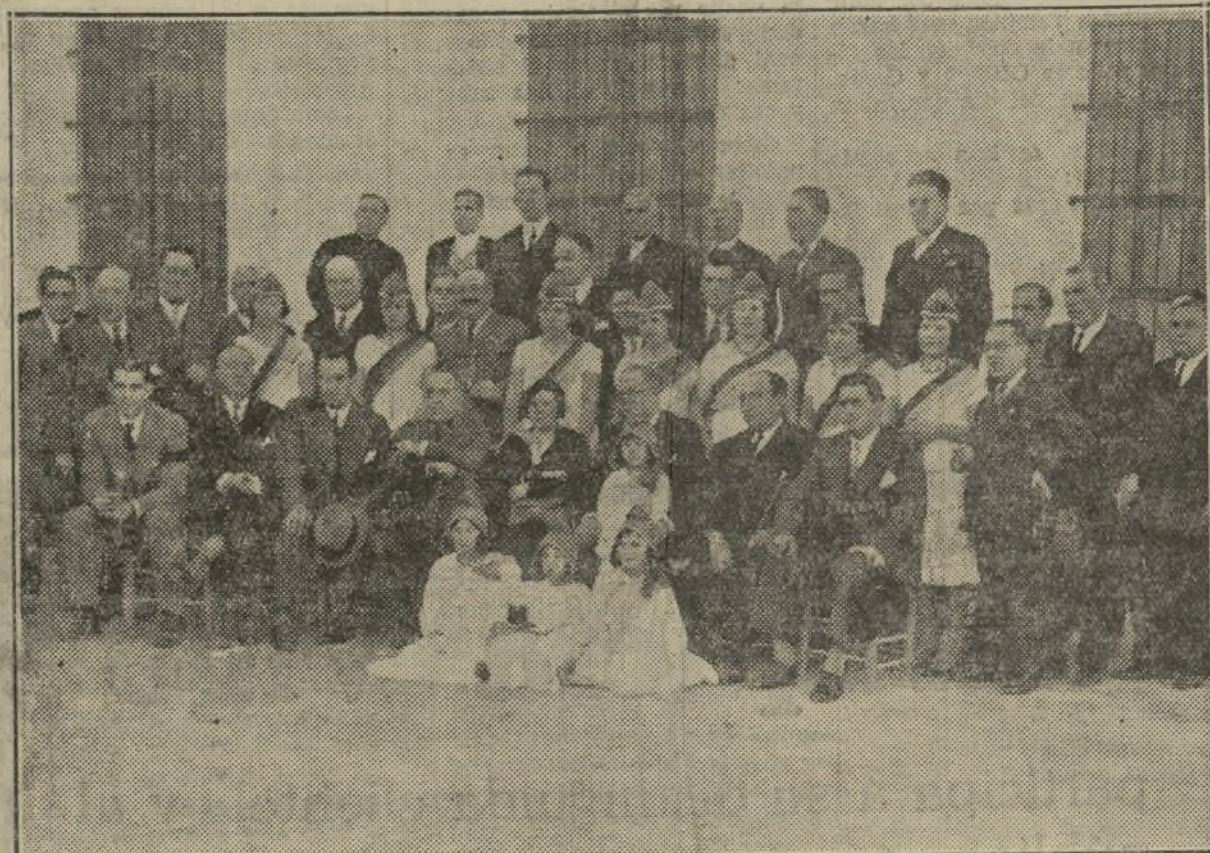
Las autoridades e invitados al acto de inauguración de varias lápidas rotuladoras en Alcudia de Crespins.