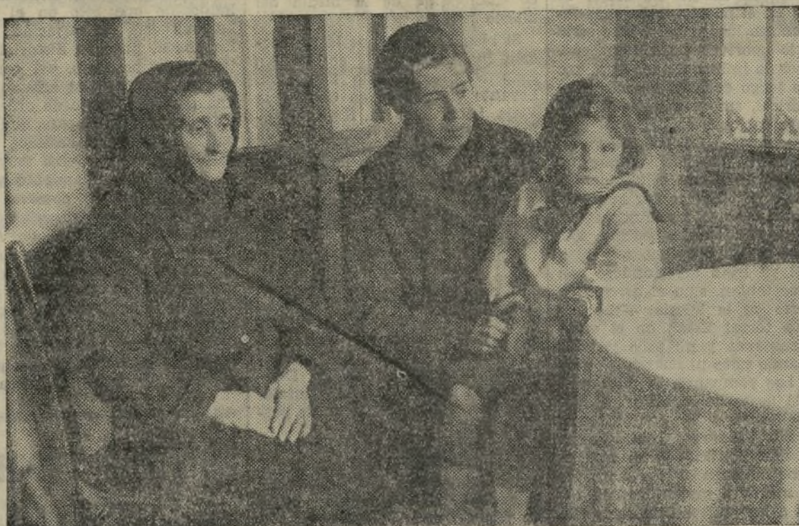
LA MADRE, ESPOSA E HIJA DEL LUCHADOR Y VÍCTIMA

No inevitable, la huelga, surgió, ante la manifiesta colaboración su-