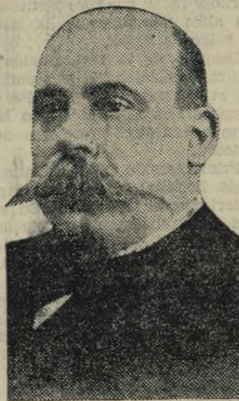
D. EMILIO CASTELAR