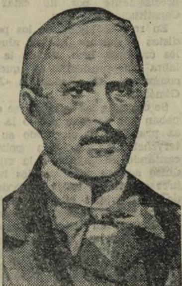
D. ESTANISLAO FIGUERAS