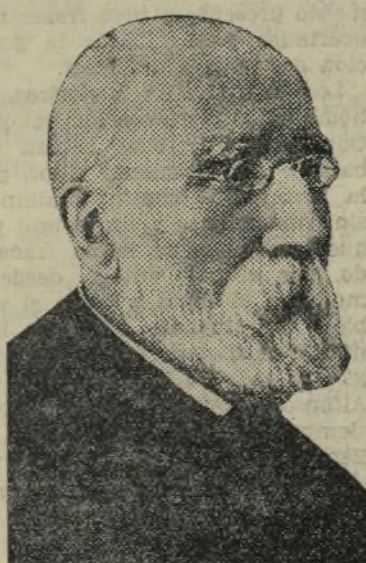
D. FRANCISCO PI Y MARGALL