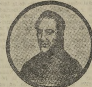
EL VIL TRAIDOR GENERAL GARCIA MORENO

nario, aunque ya quisiera yo que muchos vrogresistas fueran como los conservadores ingleses? Pues Disraeli es un judío, pero de origen español; Disraeli es un gran novelista, un grande orador, un grande hombre de Estado, una gloria que debía reivindicar hoy la nación española.