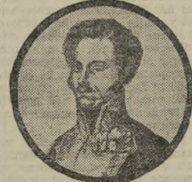
EL GLORIOSO MARTIR GENERAL TORRIJOS