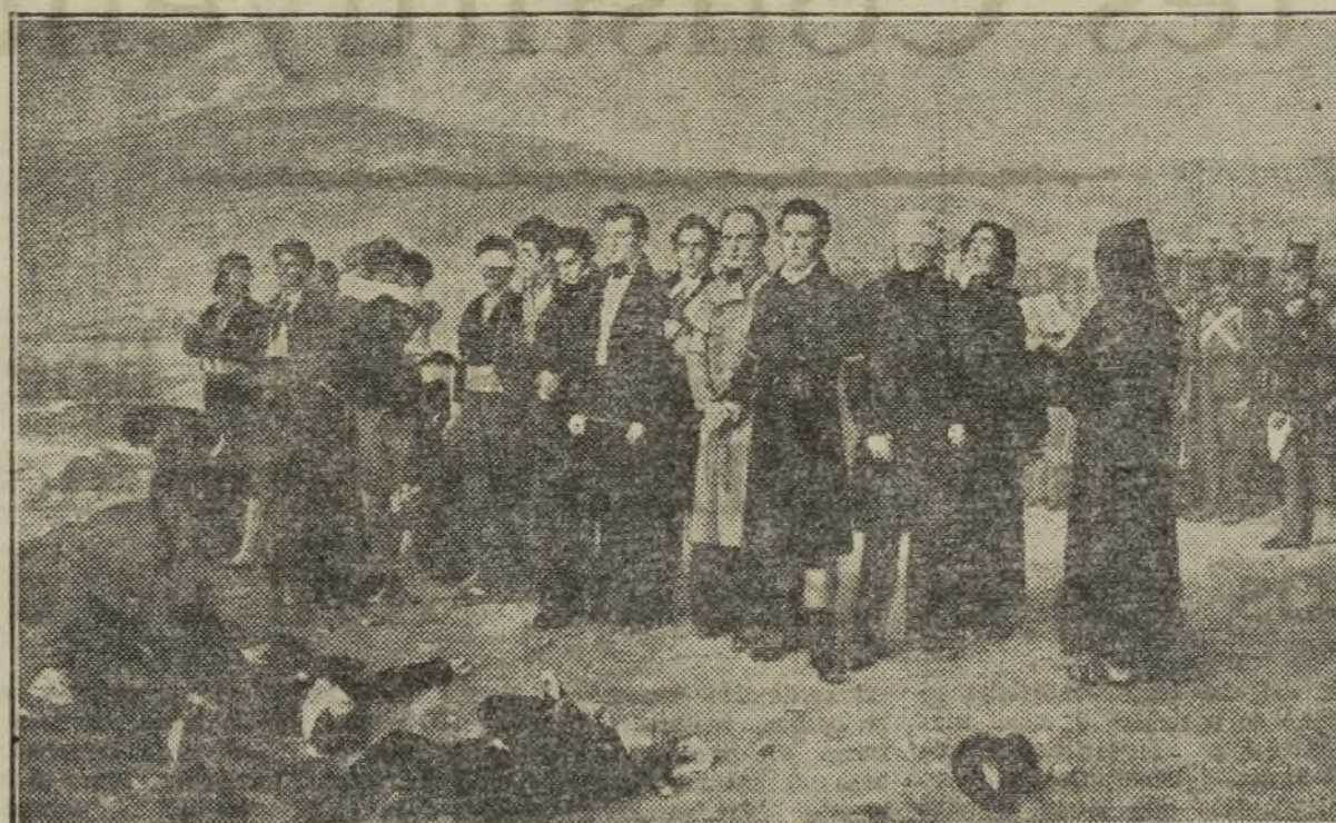
«FUSILAMIENTO DE TORRIJOS», FAMOSO CUADRO DE GIBERT, QUE SE CONSERVA EN EL MUSEO DE ARTE MODERNO