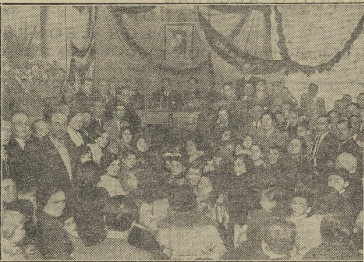
Brillante aspecto que ofrecía el salón de actos durante la inauguración de la Casa de la Democracia del distrito del Centro

Los veteranos del distrito del Centro realizaron el domingo la más fervida de sus aspiraciones: brindar al Partido de Unión Republicana Autonomista un nuevo organismo que pujante de entusiasmo resume la historia blasquista y gloriosa del distrito.