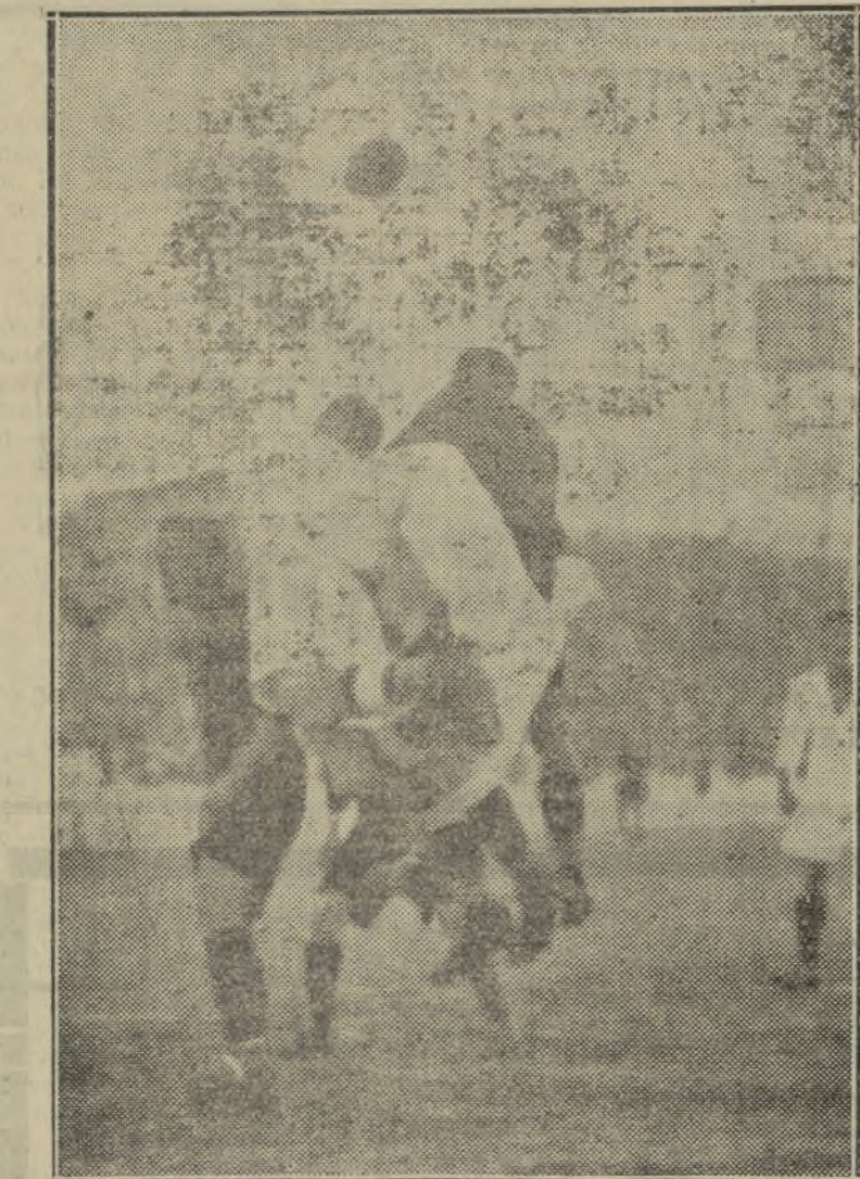
Un corner lanzado contra los madrileños en el partido del domingo

que podían hacer sus adversarios y olvidaron por completo lo que ellos hubiesen debido realizar.