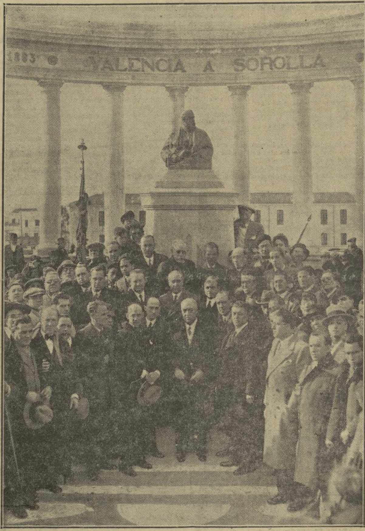
LAS AUTORIDADES, DON MARIANO BENLLIURE Y EL HIJO DEL INSIGNE PINTOR, AL PIE DEL MONUMENTO

merovelloso els va saber pintar i els feu admirar i estimar dels ulls àvids d'emoció estètiques i dels esperits plens de sensibilitat de les terres llunyanes, orbes, ones, de la gloria del nostre sol, mancats, atres de la cançó harmoniosa o del blau seré de la nostra mar o desposseïdes de l'alé diví i de l'amor de l'art.