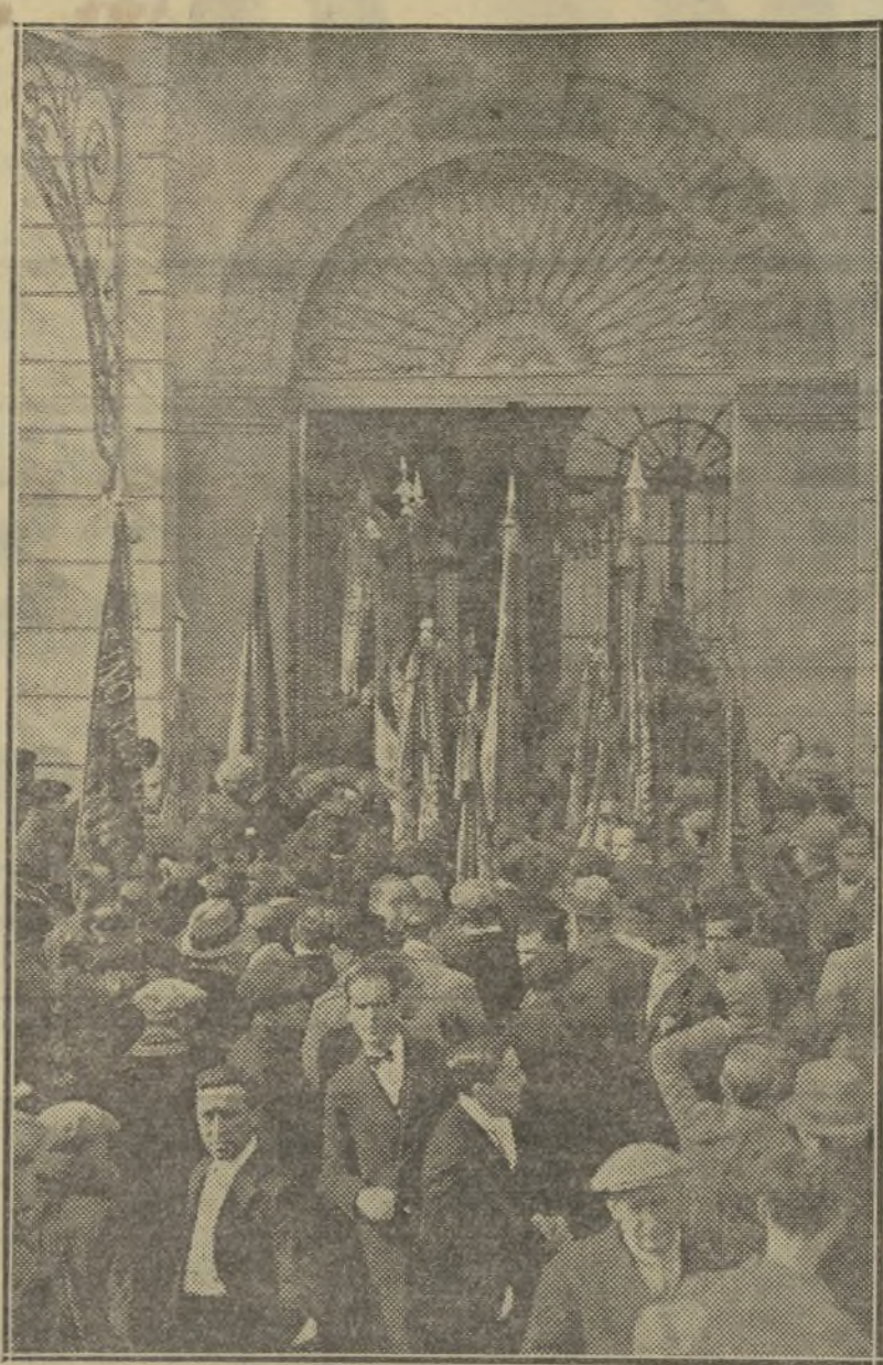
ANTE LOS RESTOS DEL MAESTRO, LA OFRENDA DE LOS REPUBLICANOS VALENCIANOS FUE UNA FERVOROSA DEMOSTRACIÓN DE LEALTAD BLASQUISTA

Centro Republicano Autonomista de Foyos. Agrupación Femenina María Blas, del Puerto. Casa del Pueblo Radical. Agrupación Femenina de la misma. Casa de la Democracia de Melilla. Rondalla Entre Naranjos. Centro Unión Republicana Autonomista del distrito de la Audiencia. Juventud Blasquista del mismo. Agrupación Femenina Mare Nost, de este centro. Centro Republicano Autonomista Fermín Galán, Cruz Cubierta. Agrupación Femenina Fermín Galán, del mismo centro. Círculo Republicano Autonomista El Ejemplo, de la Vega. Agrupación Femenina Los Enemigos de la Mujer, de El Ejemplo. Casino Republicano de Cuart de Poblet. Fratrindad Republicana del distrito del Puerto. Agrupación Femenina Félix Azza, de la misma. Agrupación Femenina Fraternidad Republicana del Puerto. Juventud de Fraternidad Republicana del Puerto. Centro Republicano Autonomista de Canals. Centro Unión Republicana Autonomista de Albal. Centro Republicano Autonomista del distrito del Teatro, Pl y Margall, 5. Agrupación Femenina El Pueblo, del mismo.