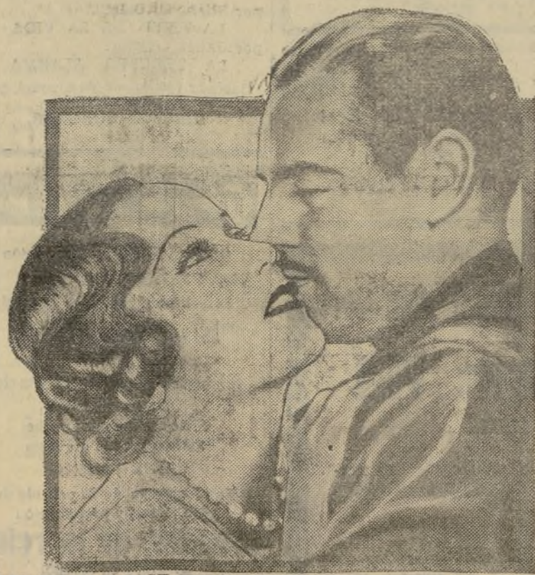
FAY WRAY Y JACK HOLT, EN UNA INTERESANTE ESCENA DE LA PELÍCULA COLUMBIA «LA MUJER DEL OTRO», DIALOGADA EN ESPAÑOL. QUE CIFESA PRESENTARÁ MUY PRONTO EN EL APOLLO CINEMA

CATALINA BARCENA MONA MARIS YO TU Y ELLA LUIS ALONSO FOX