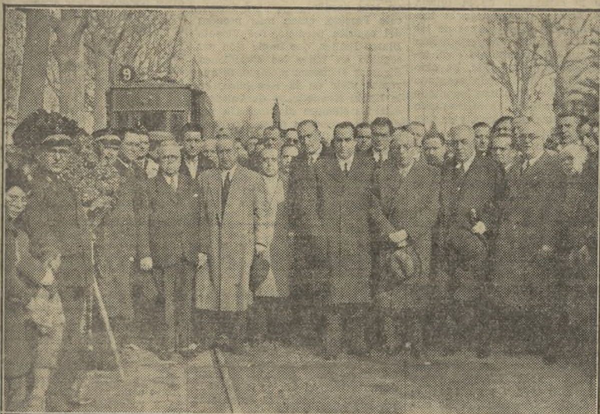
LAS AUTORIDADES AL DIRIGIRSE A HACER LA OFRENDA ANTE LOS RESTOS

dad, que absorba seguía a Blasco vivo, al semidios, erguido sobre la silla triunfal de cien banderas tricolores. La grandeza de Blasco Ibáñez disipa aún en la fecha fatal de su muerte, el dolor. Blasco tiene el hábito inmortal de lo épico, su recuerdo es una ebra fulguración de nuestra raza, vive y vivirá con ella con las fuerzas ancestrales que los genes legendarios dejan en acervo de los hombres, que ellos mismos no pueden sacudir. Donde se quibre un rayo de luz de nuestro sol, el horizonte que abarque nuestro mar, el taller en el que vibre la ufofía productora, en la huerta donde de nuestros hombres esclavizan a la propia naturaleza, en la urbe, en el caserío y en la sierra, donde el hombre sufre y goza y siente las angustias ansias de su finalidad, allí Blasco vive, porque Blasco hizo de su vida un germen y puso a los pies de su pueblo rotas