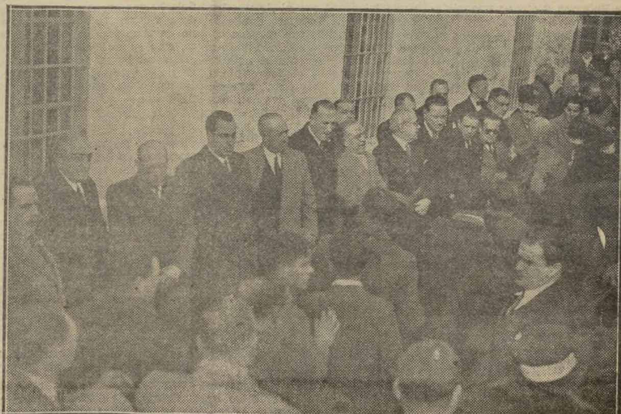
ANTE LA PRESIDENCIA DEL DUELO DESFILARON MULTITUD DE VALENCIANOS, QUE HICIERON PATENTE SU RENDIDA ADMIRACION HACIA EL MAESTRO

Centro Republicano Autonomista de Benifayó.