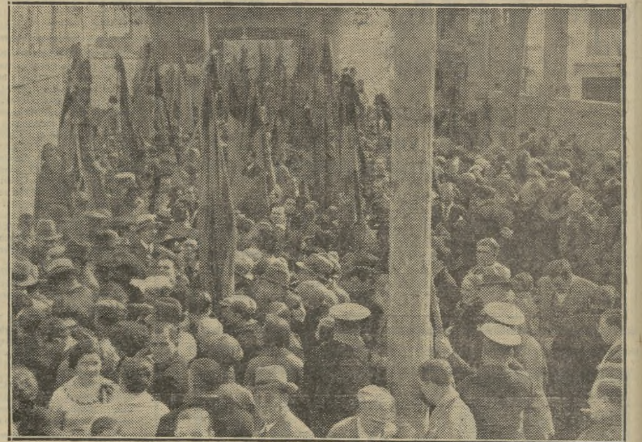
EL ACTO INAUGURAL DEL ENSANCHE DE LA CALLE DE NICOLAS FACTOR TUVO LA INUSITADA BRILLANTEZ DE LA ASISTENCIA DE NUESTRAS ORGANIZACIONES CON SUS BANDERAS

y muy singularmente a los presidentes del Casino, Juventud y Junta Municipal y sobre todo al in-