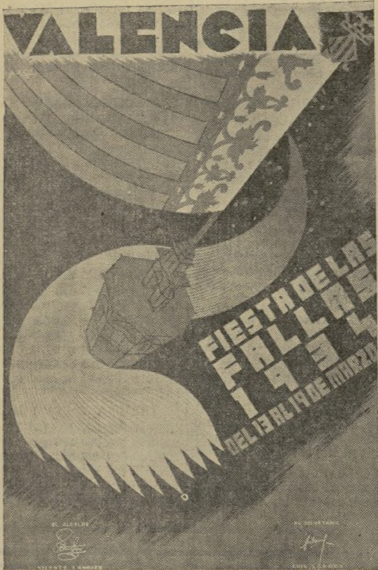
CARTEL PREMIADO POR LA COMISION DE FIESTAS DEL EXCELENTISIMO AYUNTAMIENTO, ORIGINAL DEL ARTISTA VALENCIANO SEÑOR RAGA