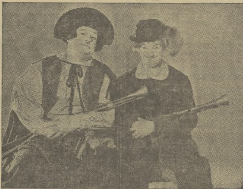
OLIVER HARDY Y STAN LAUREL, EN UNA ESCENA DE «FRA DIAVOLO», SU NUEVA PELICULA, CON LA QUE HACEN DIVERSO AL PUBLICO VALENCIANO.

La intérprete principal de esta nueva producción del célebre animador Josef von Sternberg para la Paramount, es, claro está, Marlene Dietrich.