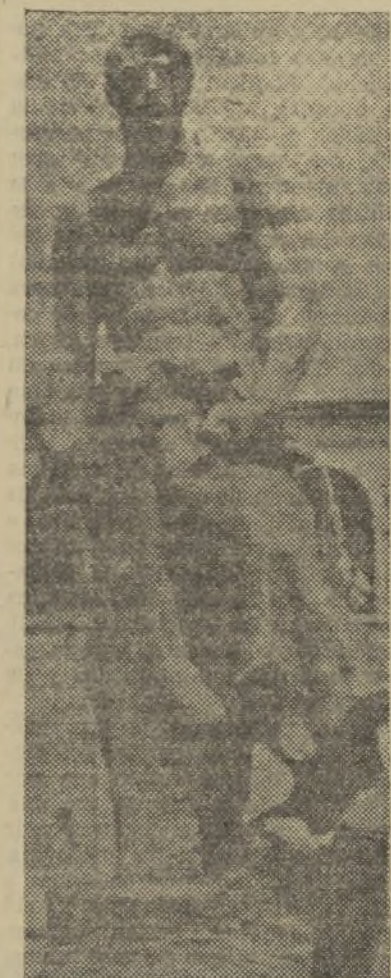
«EL TRABAJO», UNA DE LAS MAS BELLAS ESCULTURAS DE LLIMONA

artista indiscutible. Años después este mismo caso había de repetirse en Reus con el monumento a Fortuny, en que, sin ganar el concurso, el escultor Viladomat, que por cierto tiene muchas analogías artísticas con Llimona, se llevó plenamente el triunfo moral con su estatua "El Condado".