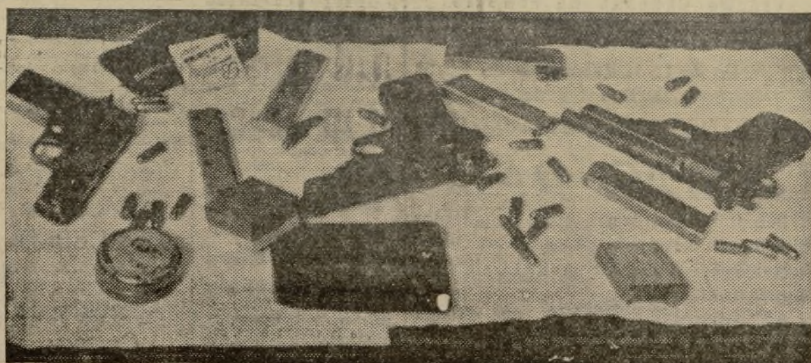
LAS ARMAS OCUPADAS POR LA POLICIA A LOS TRES ATRACADORES DETENIDOS

Durante el resto de la noche la brigada de Investigación continuó infatigablemente para conseguir la detención de otros sujetos complicados en el asunto.