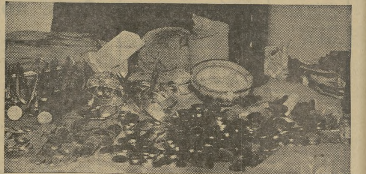
Parte de las 1.600 piezas falsas de cinco pesetas y utensilios empleados en su fabricación, que logró capturar la policía en la Avenida de los Aliados, núm. 53, bajo, de Burjasot, donde se hallaba instalada la «productiva fábrica»