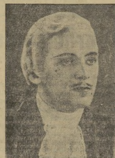
DOUGLAS FAIRBANKS (hijo)