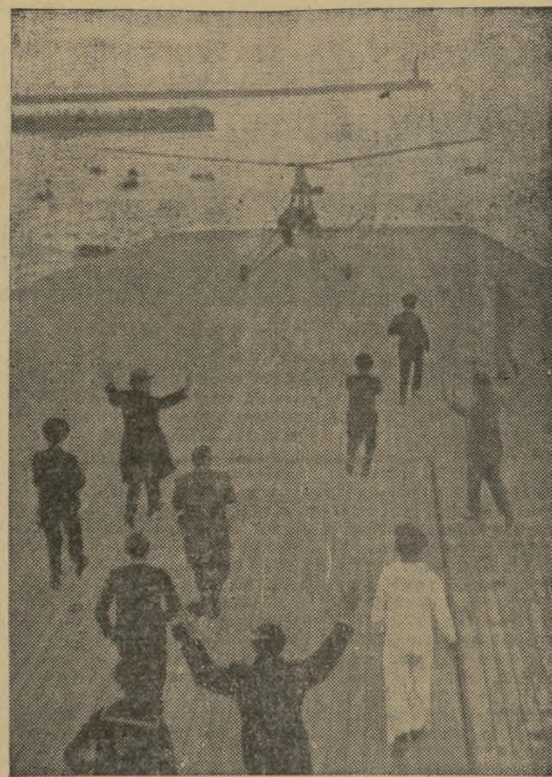
LA EXPERIENCIA REALIZADA SOBRE LA CUBIERTA DEL «DÉDALO», FUE UN ÉXITO. HE AQUÍ EL MOMENTO EN QUE EL AUTOGIRO TERMINA DE POSARSE SOBRE LA PISTA DE ATERRIZAJE DEL BUQUE PORTAAVIONES

En la caseta-taller de referencia nos llamó la atención una preciosísima lámpara, verdadera filigrana del arte manisero, imitación