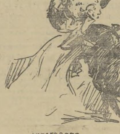
COGIDA DE SOLORZANO POR EL ULTIMO DE LA TARDE

Al segundo suyo, manso y difícil, lo despatchó de dos pinchazos y media estocada, tras unos pa-