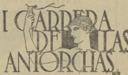
I CARRERA DE LAS ANTORCHAS

Este Comité, con el objeto de popularizar las fiestas de las fallas y con el fin de superar posiblemente los festejos de años anteriores, ponemos en conocimiento de todos los valencianos y al público en general, que los días 13, 14 y 15, en los sótanos del Mercado Central tendrá lugar la primera Exposición fallera del Ninot, que consistirá en la presentación de un ninot de cada falla para que por medio de una votación popular se indulte de la «cremá» al ninot que por mayoría de votos haya sido elegido como el mejor.