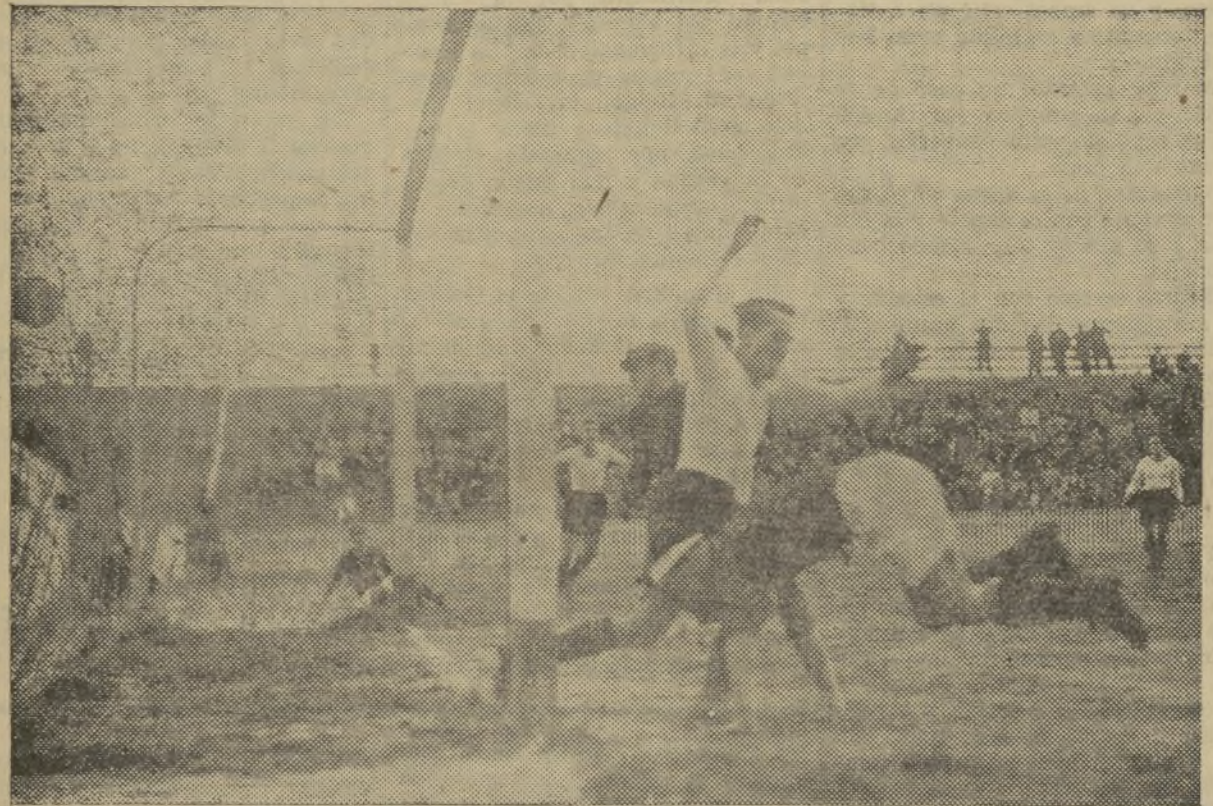
UNO DE LOS SIETE TANTOS DEL VALENCIA EN SU PARTIDO CONTRA EL RACING DE SANTANDER

Las líneas en el Valencia no fueron completas, sino en la de-