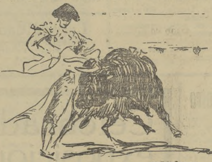
MEDIA VERONICA DE PERICAS AL SEGUNDO NOVILLO DE LA TARDE

ses en los que sufrió algunos achuchones y otros tantos desarmes.