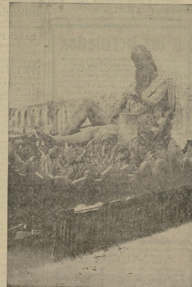
CARROZA ALEGÓRICA AL DIOS PLUTÓN, QUE FIGURO EN LA CABALGATA «FALLERA» CELEBRADA ANOCHÉ