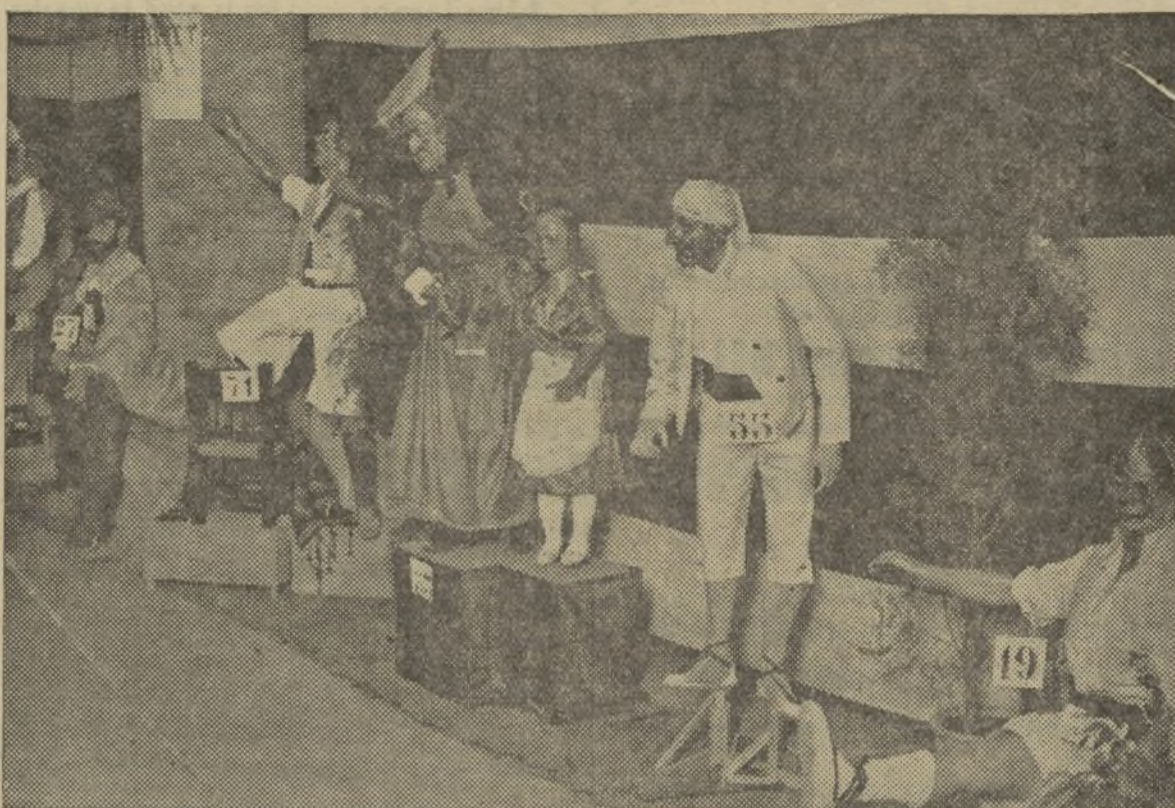
VISTA PARCIAL DE LA EXPOSICIÓN DE «NINOTS DE FALLA» INSTALADA EN LOS SOTANOS DEL MERCADO CENTRAL Y QUE HA CONSTITUIDO UN GRAN ÉXITO

Comenzaron los heraldos de Plutón anunciando a la ciudad el comienzo de las fiestas falleras y la llegada del dios del fuego y al propio tiempo que varias tracas convergían en la plaza de Castelar, un enorme gentío presenciaba las