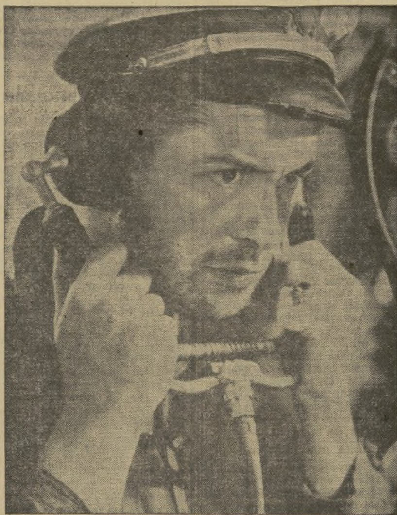
La adjunta foto es una escena de la estupenda película Metro. «Honduras de infierno», que se está proyectando en la pantalla del Capitol con éxito creciente