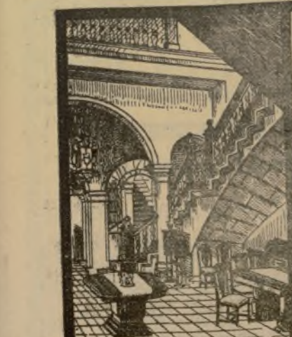
Palacio del Mueble.