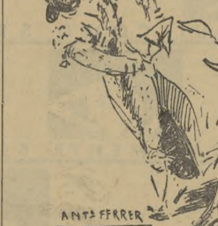
MEDIA VERONICA DE ORTEGA A UNO DE SUS TOROS

Con la muleta realizó Lalanda una faena de alifio—el bicho lle-