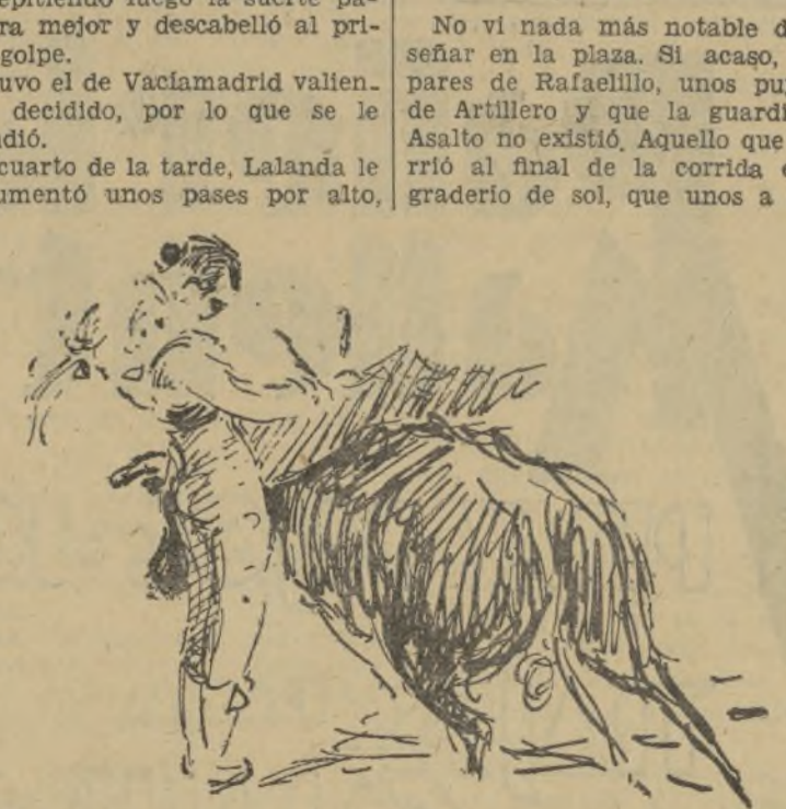
UN DERECHAZO DE LA SERNA EN UNA DE SUS TARDES

No vi nada más notable de repañar en la plaza. Si acaso, unos pares de Rafaelillo, unos puyazos de Artillero y que la guardia de Asalto no existió. Aquello que ocurrió al final de la corrida en el graderío de sol, que unos a otros